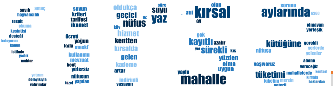
Şekil 1. Bürokratların Kırsal Mahalle Hakkındaki Kelime Bulutu

Saha araştırması kapsamında öncelikle bürokratlarla görüşülmüş olup, söz konusu görüşmecilere özgü sorular, bulgular ile yorumlar ve kodlama rehberine aşağıda yer verilmiştir. Şekil 1'de bürokratların konuya dair söylemlerinden elde edilen kelime bulutu yer almaktadır.