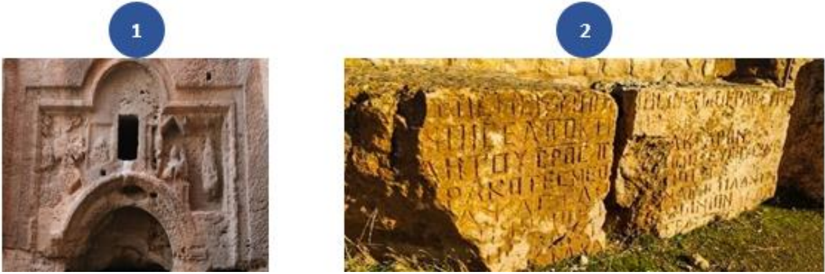
řekil 6: Dara Antik Kenti'nde Dini Anlamlar İçeren Tař Eserler (1: Hezekiel'in Tasvir Edildiđi Düşünölen İkonografik Sahne, 2: 6. yüzyıla Tarihlenen Hz. İsa'nın Abgar Kralına Yazmıř Olduđu Mektubun Tařa İřlenmiř Kopyası) (Mardin Müzesi Kazı Arřivi)