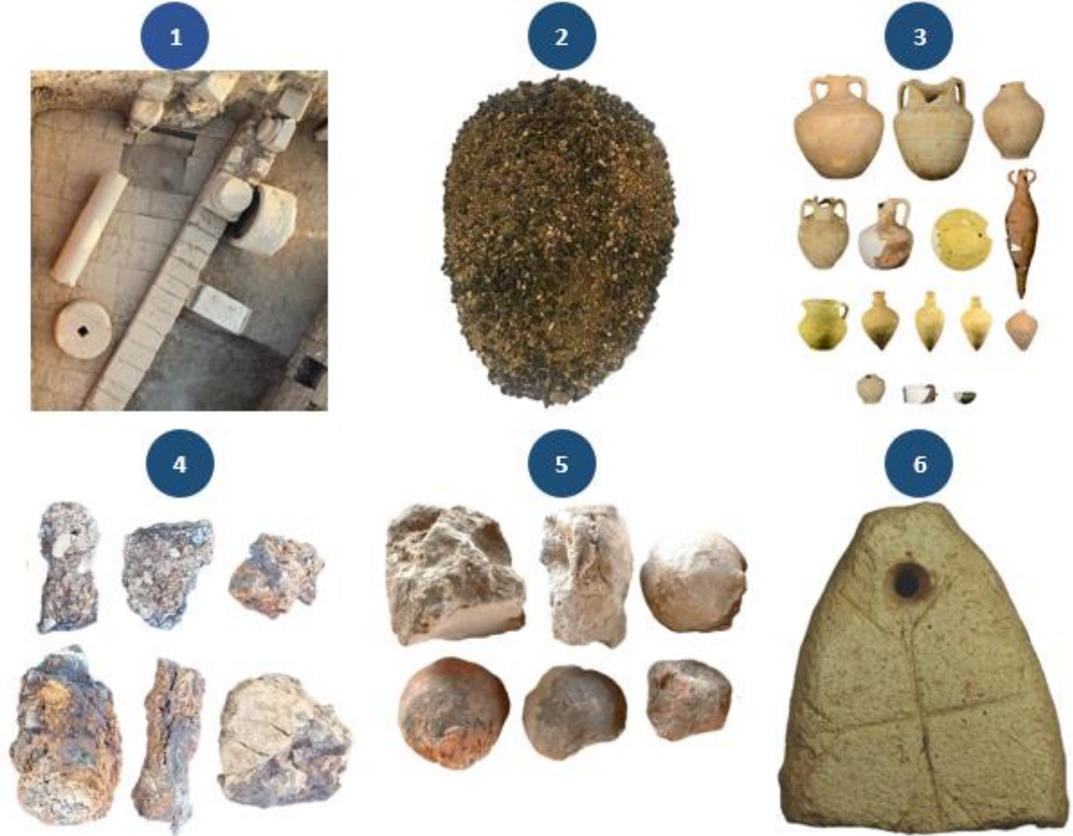
Şekil 4: Dükkânlar, Mekanlar ve Bağlantılı Alanlarda Ortaya Çıkarılan Buluntuların Genel Görünümleri (1: Zeytin Yağ İşliği, 2: Yanmış Buğday Tohumları, 3: Pişmiş Toprak Kaplar, 4: Demir Cüruflar, 5: Alçı Taşları, 6: Tezghâh Ağırlıkları)

Kentte son dönemlerde nekropol, Büyük Kilise çevresi, güney sur kapısı ve agoranın güneybatısında yapılan kazı çalışmalarında dini anlamlar içeren eserler bulunmuştur (Şekil 5). Bulunan eserler; kente askeri ve ticari görevlerinin dışında, dini amaçlı birtakım misyonların yüklenmek istendiğini göstermektedir. Nekropol alanında yapılan kazı çalışmalarında, galeri mezar olarak adlandırılan üç katlı büyük mezar odası bulunmuştur. Mezar odasının anıtsal giriş kapısının üstünde yer alan ikonografik sahne, kentte görülen en önemli dini semboller içerisindedir. Peygamber Ezekiel/Hezekiel'in tasvir