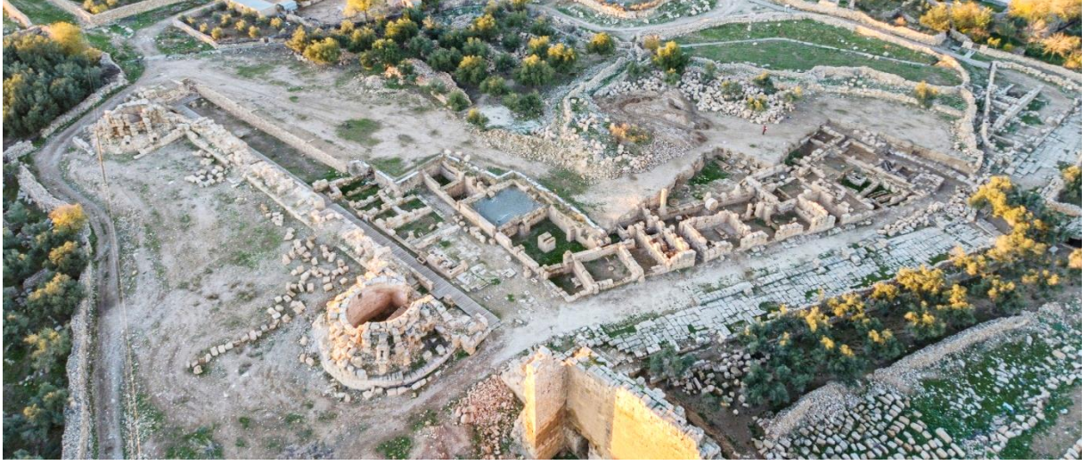
Şekil 3: Dara Antik Kenti'nde Bulunan Agora Alanının Genel Görünümü