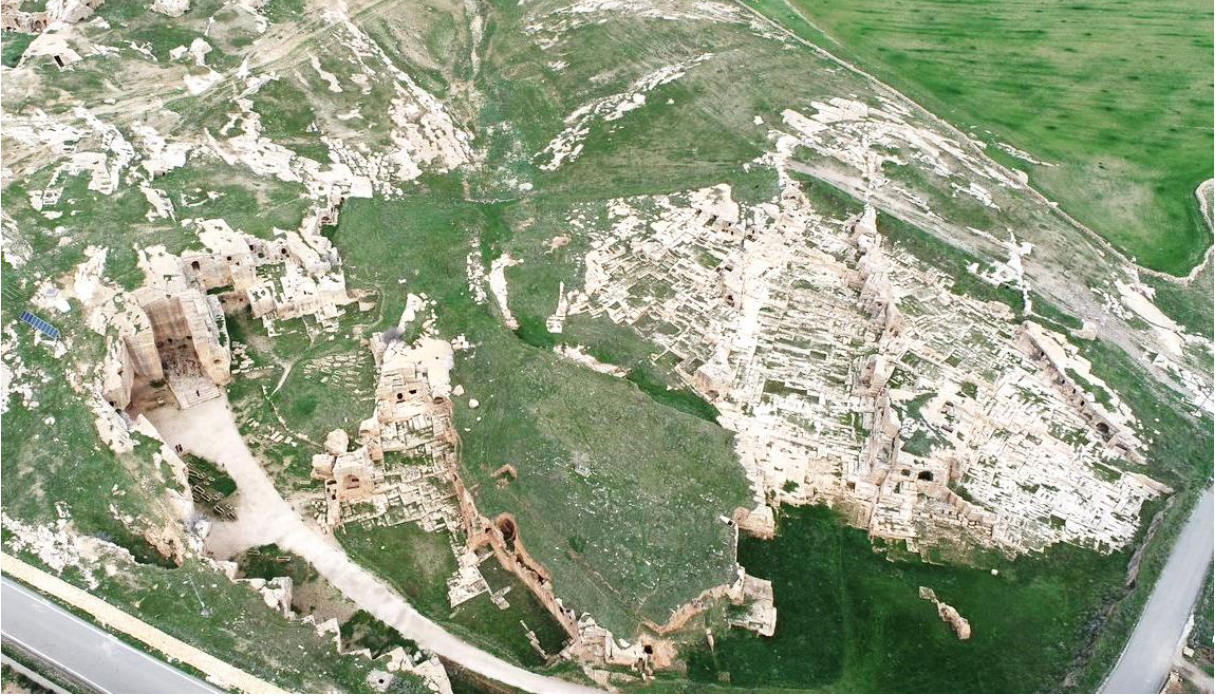
řekil 5: Dara Antik Kenti'nde Bulunan Nekropol Alanının Genel Görünümü (Mardin Müzesi Kazı Arřivi)

edildiği düşünölen ikonografik sahne, sadece Dara'da görölen önik bir eserdir (Mundell, 1975: 213-214). Ayrıca 2018 yılı kazı çalıřmalarında, kentin güney giriř kapısının önünde Hz. İsa'nın Abgar kralına yazmıř olduđu mektubun kopyasının iřlendiđi büyük blok tařlar bulunmuřtur. Bu yazıt 6. ve 7. yüzyıllarda kentin dini açından önemli bir konumda olduđunu göstermektedir (řekil 6).