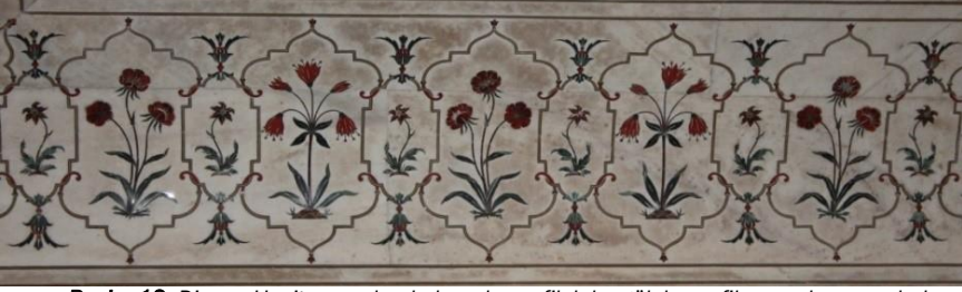
Resim 12: Divan-ı Has'ta yer alan kakma karanfil, lale, gül, karanfil, menekşe, zambak, sümbül gibi çiçek tasarımları.