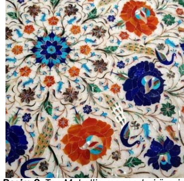
Resim 2: Taç Mahal'in mermerleri üzerindeki değerli taşlarla yapılan kakmalar.