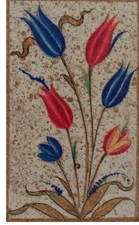
Resim 4: Muhibbî Divanında yer alan lale motifleri.