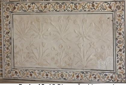
Resim 13: 13 Divan-ı Am'da yer alan kabartma karanfil, lale, gül, karanfil, menekşe, zambak, sümbül gibi çiçek tasarımları.