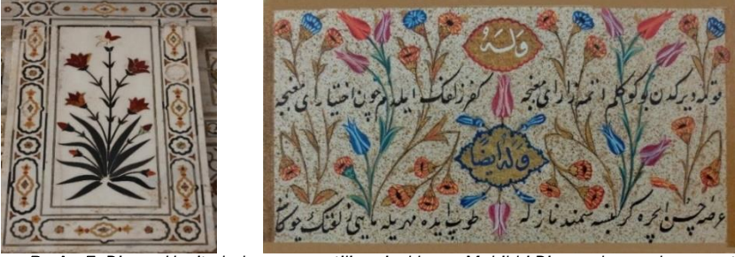
Resim 5: Divan-ı Has'ta bulunan yarı stilize çiçekler ve Muhibbi Divanında yer alan yarı stilize çiçekler.