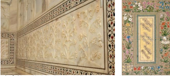
Resim 6: Divan-ı Has'ta bulunan yarı stilize kabartma çiçekler ve minyatürlerde yer alan tasarımlar.