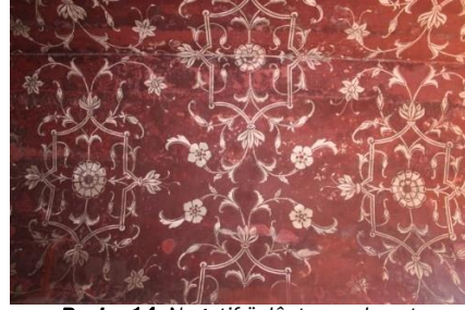
Resim 14: Negatif üslûpta yapılmış tasarımlar.