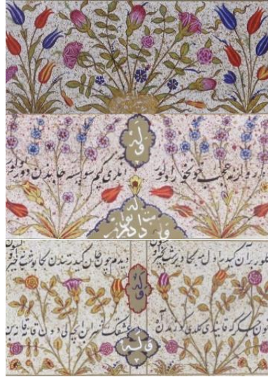
Resim 10: Muhibbî Divanında yer alan karanfil, lale, gül, karanfil, menekşe, zambak, sümbül gibi çiçek tasarımları.