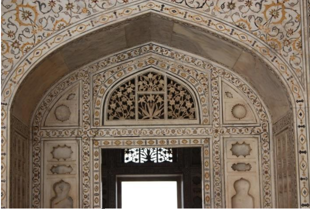
Resim 15 Divan-ı Am'da bulunan ajur tekniğinde çiçek tasarımları.