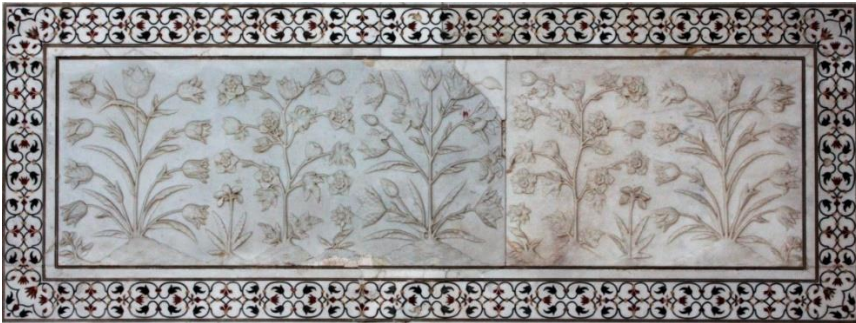
Resim 11 Tac Mahal'de yer alan kabartma karanfil, lale, gül, karanfil, menekşe, zambak, sümbül gibi çiçek tasarımları.