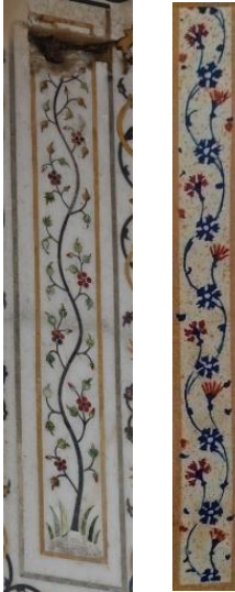
Resim 9: Agra Kalesi Divan'ında ve Muhibbi Divanında görülen kıvrımlı çiçek dalları.