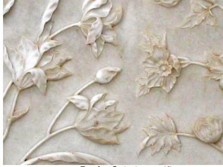
Resim 3: Lale motifi.