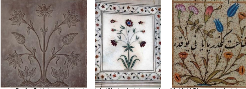
Resim 8: Kakma ve kabartma tekniğinde çiçek tasarımları, Muhibbi Divanında çiçek tasarımları.