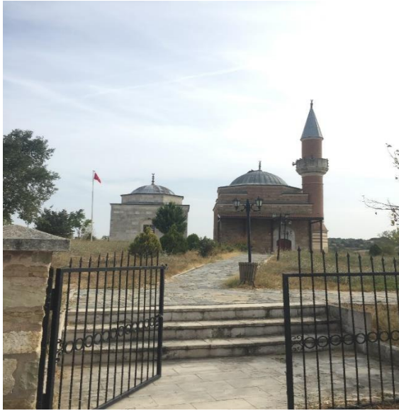
Resim 2: Gazi Turahan Bey Camii ve Türbesi Uzunköprü-Kırkkavak Köyü