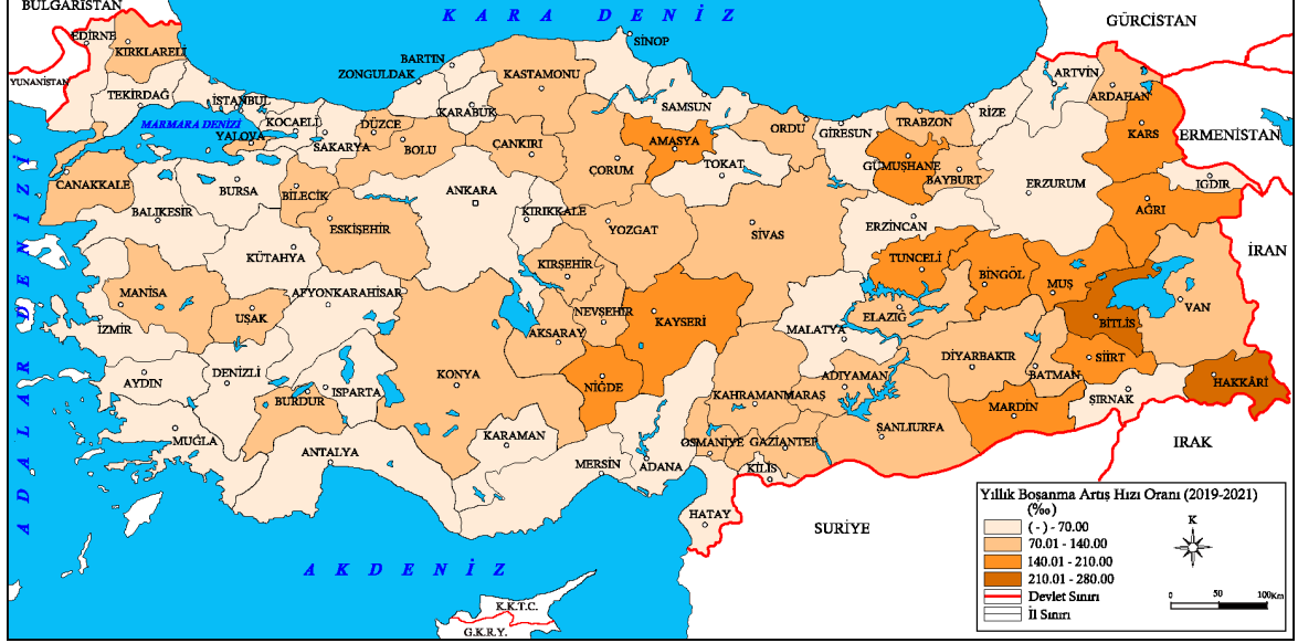
Harita 4. Türkiye’de yıllık boşanma artış hızı (2019-2021).

olan iller Hakkâri (%230,52), Bitlis (%216,75), Niğde (194,92) Mardin (%178,56), Gümüşhane (%170,35), Bingöl (%163,75), Siirt (%162,97), Muş (%159,23), Ağrı (%158,17) ve Kars (%157,12)’tir. Yıllık boşanma artış hızı oranının en düşük olduğu iller ise Erzurum (%-95,53), Bartın (%-35,24), Iğdır (%-11,86), Isparta (%3,81), Zonguldak (%4,06), Tekirdağ (%9,86), Artvin (%9,17), Balıkesir (%10,60), İzmir (%18,68) ve Sinop (%20,51)’tur (Harita 4).