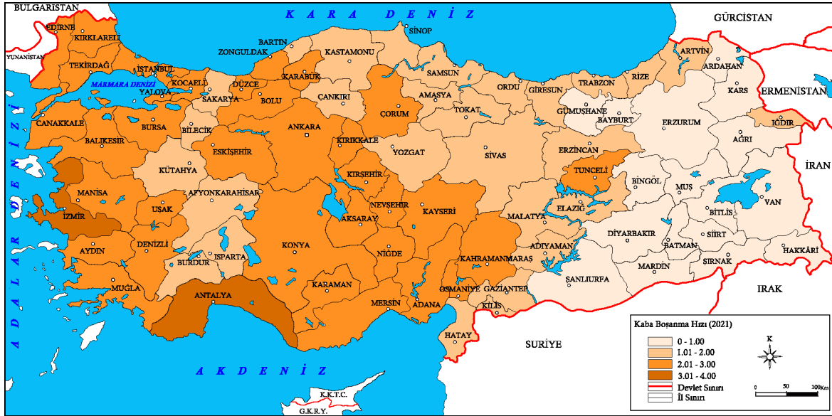
Harita 3. Türkiye'de kaba boşanma hızı (2021).

Türkiye'de KBH'si yüksek olan iller büyük oranda sosyo-ekonomik açıdan gelişmiş, düşük olan iller ise az gelişmiş veya gelişmemiş illerden oluşmaktadır. Ancak KBH, boşanmalardan en çok etkilenen alanları göstermemekte ve belirli bir alandaki boşanma artış hızını gizlemektedir. KBH'de meydana gelen artış oranlarının Doğu ve güneydoğu illerinde daha çok olduğunu destekleyen diğer bir gösterge de yıllık boşanma artış hızı oranı dır. Türkiye geneli yıllık boşanma artış hızının en yüksek olduğu yıllar 1940 (%107,13), 2001 (%970,33), 2009 (%135,82) ve 2021 (%242,71) olmuştur. 2021 yılı hariç olmak üzere diğer yıllar uluslararası ve ulusal düzeyde ekonomik krizlerin yaşandığı yıllara tekabül etmekteyken, 2021 yılı da Covid-19 pandemisi dönemine tekabül etmektedir. 2019 ile 2021 yılına ait boşanma sayılarına göre elde edilen yıllık boşanma artış hızı oranına göre; pandemi döneminde yaşanan olumsuz şartların, boşanmalar açısından en fazla sosyo-ekonomik yönden az gelişmiş ve gelişmemiş illeri etkilediği ortaya çıkmaktadır. Bir başka deyişle KBH en düşük olan iller, yıllık boşanma artış hızı en yüksek; KBH en yüksek olan iller ise yıllık boşanma artış hızı düşük olan iller olarak karşımıza çıkmaktadır. 2019-2021 yılları itibariyle yıllık boşanma artış hızı en yüksek