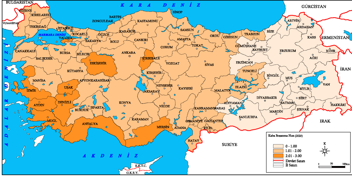
Harita 2. Türkiye'de kaba boşanma hızı (2020).

gelişmemiş veya az gelişmiş iller, pandemi dönemi şartlarından daha fazla etkilenmiş ve bu durum iki dönem arasındaki oransal farkın yüksek olmasına neden olmuştur.