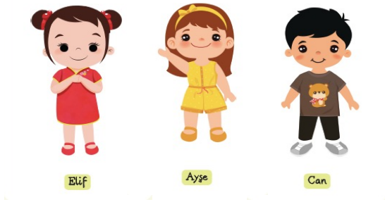
Şekil 1. 36-72 Aylık Çocuklar için Değerler Bataryası Hikâye Görselleri

lenmiştir. 36-48 aylık çocuklar için yardımseverlik (paylaşma-yardımlaşma-iş birliği), sorumluluk, sevgi, mutluluk, nezaket, sabır ve adalet; 49-60 aylık çocuklar için bunlara ek olarak çalışkanlık, merhamet, hoşgörü ve dostluk; 61-72 aylık çocuklar için ise bunlara ek olarak dürüstlük, güvenilirlik, saygı, barış ve ülkesine ve toplumuna bağlılık olmak üzere 16 farklı değer kazanımı olarak belirlenmiştir. Belirlenen değerler listesi çocukların yaşlarına uygunluk açısından 7 uzman görüşüne sunulmuş ve uzmanların görüşleri, ilgili literatür ile programlar çerçevesinde düzenlenmiştir. Ardından, yaş grubunun özellikleri göz önünde bulundurularak değerler gibi soyut kavramların somutlaştırılmasına imkân veren bir strateji olması açısından ölçek maddeleri hikâyeleştirilmiş ve soruları görselleştirebilmek amacıyla 2 kız çocuğu ve 1 erkek çocuğu görseli kullanılmıştır. Görseller seçilirken çocukların dikkatinin hikâye dışındaki bir öğeye yönelmesini engelleyecek basit ve sade figürler olmasına özen gösterilmiştir. Ölçek uygulama sürecinde yararlanılan görsellere Şekil 1’de yer verilmiştir.