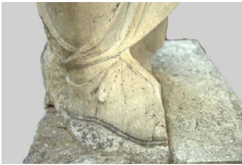
Levha 4: Koloe Erkek Heykeli, sandalet detayı.