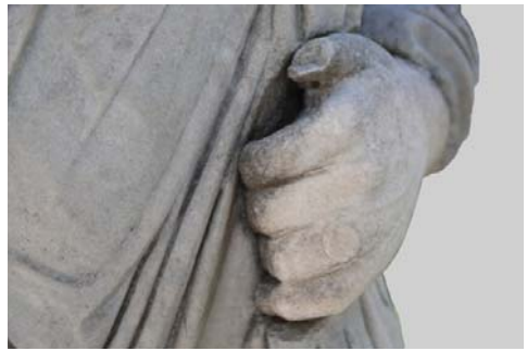
Levha 5: Koloe Erkek Heykeli, el detayı.