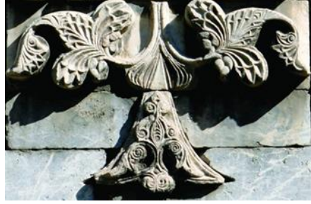
Şekil 8: Sivas Gök Medrese hayat ağacı taş bezemesi, (Detay), Sivas/TÜRKİYE

kartal sembolü, tanrının gökleri koruyan bekçisi konumunda düşünülmektedir. Bununla birlikte Gök Medrese de bulunan hayat ağacı sembolünün kök kısmına doğru konumlandırılmış, kelime anlamı “Anadolu’ya ait” olan Rumi motifinin sıklıkla kullanıldığı görülmektedir (Şekil 8).