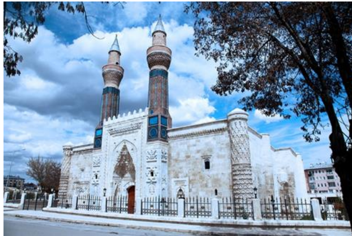
Şekil 5: Sivas Gök Medrese

Anadolu Selçuklu Sultanı IV. Kılıçaslan'ın ođlu III. Gıyaseddin Keyhüsrev döneminde, Sahip Ata Ali Hüseyin tarafından 1271 yılında Kaluyan el- Koneviye'ye yaptırılan Sivas Gök Medrese (Şekil 5) aynı zamanda Sahibiye Medresesi olarak da bilinir. Evliya Çelebi'nin Seyahatnamesinde de övgü ile yer bulmuş olan medrese, Anadolu Selçuklu döneminde yapılmış olan en önemli yapılar arasında yer almaktadır. Dört eyvanlı, dikdörtgen ve iki katlı bir yapıda inşa edilmiştir. Bir mescidi ve 24 odası bulunan medrese, ön cephede bir taç kapı ve iki minareten oluşur. Bununla birlikte yapının güneyine bakan duvarda üç, kuzeyine bakan duvarda ise iki olmak üzere toplam da beş kule bulunmaktadır. Yapının girişı dört koldan oluşan yıldız şeklinde yuvarlak bir kubbe ile örtülmüştür. Medrese içerisindeki salonların köşelerinde sivri beşik tonozlar yer almaktadır. Medresenin ortasında altıgen şeklinde yapılmış bir süs havuzu bulunmaktadır. İnşasında kullanılan mavi tondaki mozaik ve çini bezemelerden dolayı Gök Medrese Yapının geneline hâkim olan bitkisel ve geometrik bezemeler, medresenin estetik görüntüsünü destekler nitelikte yapılmıştır. Kurulduđu dönemde gök bilimleri üzerine arařtırmalar yapılması amacı ile inşa edilmiş olan Sivas Gök Medrese Selçuklu Dönemi vakıf eserlerine çok güzel bir örnek oluşturmıştır.