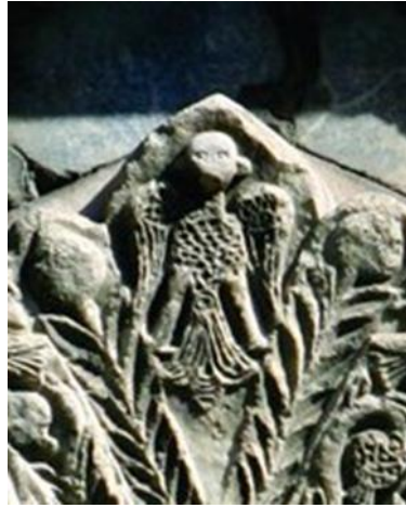
Şekil 7: Sivas Gök Medrese hayat ağacı taş bezemesi,(Detay), Sivas/TÜRKİYE

Ezoterik düşünce biçiminin de Yer, gök ve yer altını birleştirdiği düşünülen, Dünya literatürüne de axis mundi olarak geçmiş olan kozmik direk, Selçukluların hayat ağacı sembolünde de yerini bulmuş bir şekil olarak karşımıza çıkmaktadır. Kökleri ile yeryüzünü, göğe uzanan dalları ile de cennete ulaşma gayesini temsil eden hayat ağacı sembolü palmetlerden oluşmuştur. Palmetlerin yoğun olarak kullanıldığı bu sembolde Selçukluların temel simgelerinden olan çift başlı kartal, hayat ağacının tepesinde konumlandırılmıştır. Özellikle Selçuklularda Çift başlı kartal sembolü adaleti, kudreti, asaleti ve koruyuculuğu temsil etmektedir. Çift başlı olarak tasvir edilen kartal hem doğuyu hem batıyı gözetmektedir (Şekil 7).