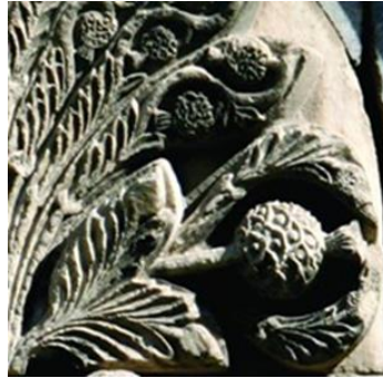
Şekil 9: Sivas Gök Medrese hayat ağacı taş bezemesi,(Detay), Sivas/TÜRKİYE

Hayat ağacı bezemesinin içinde yer alan ezoterik sembollerden biri de nar tasvirleridir. Elnara Ziyadinova, Kırım Tatar Halk Türklerinde sembol olarak bitkiler isimli çalışmasında nar sembolünün medeniyetlerdeki yerine değinerek bazı medeniyetlerde hayat ağacının meyvesinin olduğuna, bazı medeniyetlerde mucizevi bir ilaç olarak kullanıldığına, bazı medeniyetler de ise cennet elması ya da cennet meyvesi olarak anıldığını belirtmiştir (Ziyadinova 2006: 106). Bununla birlikte Pervin Ergün, Türk Kültüründe ruhlar ve orman kültü başlıklı çalışmasında narın hayat ağacı sembolünün meyvesi özelliğini taşıdığını belirterek, bu ağacın kutsallığı ve nar ile bağlantısı üzerinde durur (Ergün, 2010:114). Hayat ağacının meyvesi niteliğinde olan nar sembolünün bazı inanışlarda nazardan korunmak için kullanıldığı da bilinmektedir (Şekil 9).