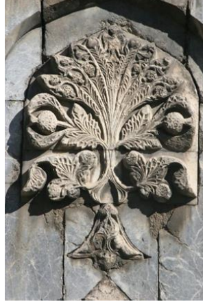
Şekil 6: Sivas Gökmedrese hayat ağacı taş bezemesi, Sivas/TÜRKİYE

Sivas Gök Medresenin girişinde yer alan gösterişli şekilde yapılmış olan taç kapının sağ ve sol kısımlarında konumlandırılmış olan sekiz köşeli yıldız sembolünün yerküreyi ve dünya yaşamını temsil ettiği düşünülebilir. Sekiz köşeli olarak sembolize edilmiş iki bezemenin ortasına denk gelecek şekilde uygulanmış olan hayat ağacı bezemesinin (Şekil 6) ise “axis mundi” adı verilen kozmik direği, devleti, devletin kudretini, yaşamı, ölümsüzlüğü temsil ettiği söylenebilir.