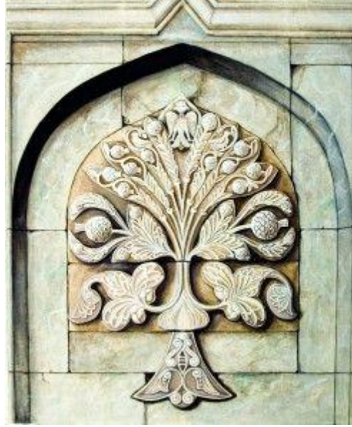
Şekil 1: Hayat Ağacı

her toplumun ağaca yüklediği anlama göre farklı isimler ile adlandırılmıştır. Yaşadığımız Anadolu coğrafyasında özellikle Türklerin Anadolu'ya yerleşmesinden sonra çok sık karşılaşılan sembollerden biri Hayat Ağacı Sembolü olmuştur (Şekil 1). Bununla birlikte çeşitli şekillerde zeytin, akasya, defne, çam gibi ağaç türlerinde tasvir edilen hayat ağacı, Türk ve dünya mitolojisinde de karşımıza sıklıkla çıkmaktadır (Ersoy, 2007). Bu sebepten hayat ağacı sembolünün dünya ve Türk kültüründeki yerine kısaca değinilmesi ve bu sembolü ezoterik göstergelere göre inceleme yoluna gidilmesi çalışmanın bütünlüğü açısından önemlidir.