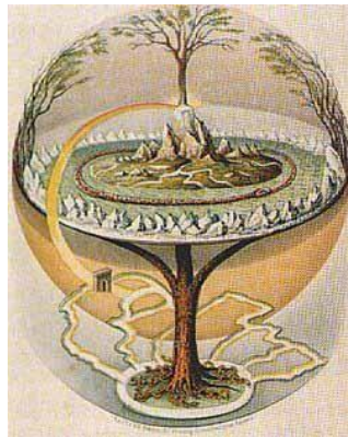
Şekil 3: Axis Mundi