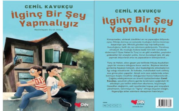
Şekil 1. İlginç Bir Şey Yapmalıyız Adlı Yapıtın Ön ve Arka Kapak Resmi

Aşağıda yapıtlarda kullanılan kapak resimleriyle ilgili kesite yer verilmektedir.