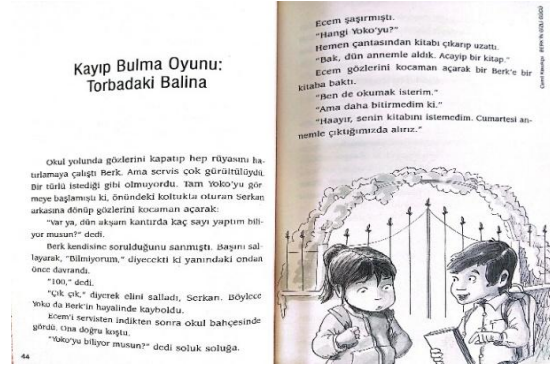
Şekil 2. Ecem Ve Berk'in Kitap Hakkında Konuşmaları (Berk'in Gizli Gücü, s. 44-45)

Aşağıda yapıtlarda kullanılan resimlerin anlatıları somutlaması ile ilgili kesite yer verilmektedir.