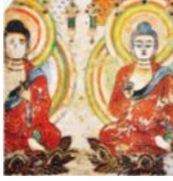
Uygur Dönemi Fresko-9. veya 10.Yüzyıl (Ayğan, 2014: 118)