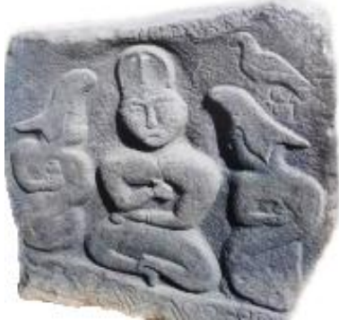
Göktürk Dönemi Lahit-8. Yüzyıl (Gömeç, 2019: 56)