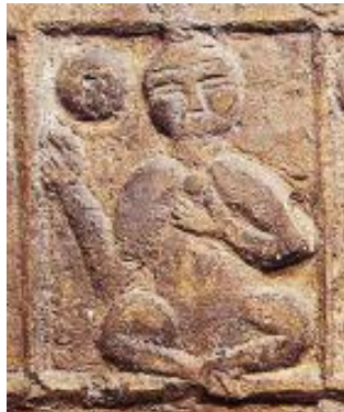
Artuklu Dönemi Kabartma-13. Yüzyıl (Bozer ve Çeken, 2016: 350)