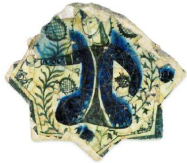
Anadolu Selçuklu Dönemi Çini-13. Yüzyıl (Arık, 2000:134)