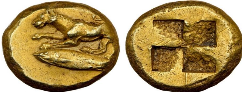
Sikke-3: Kyzikos, MÖ 550-450. Sikkenin ön yüzünde bir aslan ve ton balığı tasviri bulunmaktadır (SNGAul 7297; Von Fritze, 1912, nr. I, 85).