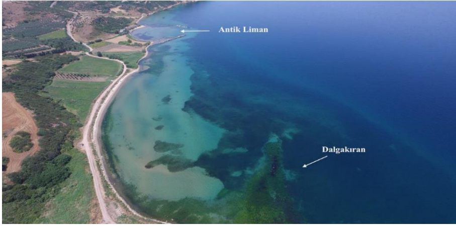
Resim 1: Şirinavuş Antik Limanı (Gündüz, 2021: 646; Dumankaya, 2018b: 128).

Antik liman ve dalgakıran çevresinde yapılan yüzey arařtırmalarında ele geen buluntular Klasik ve Hellenistik Döneme tarihlenmektedir. Buluntular arasında MÖ 4. yüzyıla tarihlendirilebilecek kaseler ile Ge Roma Dönemi özellikleri gösteren seramik paraları öne çıkmaktadır (Dumankaya, 2018b: 128; Dumankaya vd., 2019: 211). Liman çevresinde ele geen seramikler, lahitler, ve sütun başlıkları antik limanın kullanımına dair önemli ipuçları vermektedir (Dumankaya, 2019: 21).