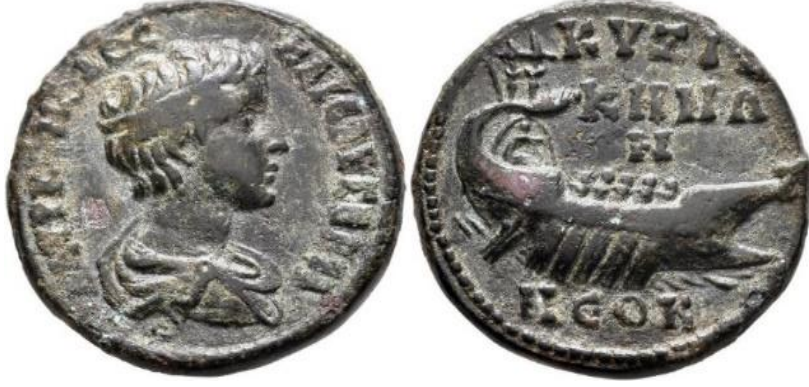
Sikke-1: Kyzikos, MS. 166-177. Sikkenin ön yüzünde Α ΑΥΡ ΚΟΜΟΔΟC ΚΑΙCΑΡ ΓΕΡΜ yazısı ve henüz caesar unvanı olan Commodus'un büstü yer alır. Arka yüzünde ΚΥΖΙ/ΚΗΝΩ/Ν/ΝΕΟΚ yazısı, kürekçiler ve dümencinin bulunduğu kadirga vardır (RPC IV.2)