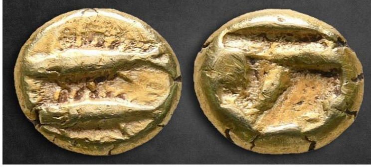
Sikke-2: Kyzikos, MÖ 550-500. Sikkenin ön yüzünde görülen iki ton balığının biri sağa, diğeri sola doğru yüzüyor şekilde tasvir edilmiştir (Von Fritze, 1912, nr. I,15).

20. yüzyıl başlarında bölgeye gelen Rustafjaell limanının iki granit mendirekle çevrelendiğini belirtmiştir (Rustafjaell, 1902: 181). Liman çevresinde MÖ 4. yüzyıla tarihlenen çok sayıda seramik parçası bulunması bölgede dış ticarete yönelik seramik atölyelerinin varlığına işaret eder (Yaylalı ve Özkaya, 1996, 311 vd.; Korkmaz ve Has, 2014: 268). Alanda sualtı araştırmaları yapan S. Gündüz'e göre burada yapılacak kapsamlı kazılarda in situ olarak gemilerin bulunabilme olasılığı yüksektir (Şahin ve Gündüz, 2010: 181). Aristides burasını Phasis'ten (Poti) Cadiz'e ulaşan deniz ticaret yolunun ve ton balığı ticaretinin önemli üslerinden biri olarak gösterir (Aristides, 16; Türk, 2022: 60-1; Ertüzün, 1999: 107). Kentin bastığı sikkeler üzerinde sıkça rastlanan "ton balığı" tasvirleri bu ticaretin kent ekonomisi için önemini göstermektedir (SNGAul 7326, 7329, 7339; Von Fritze, 1912, nr. I, 14; I, 30; I, 70; I, 72; I, 74; Tekin, 2007: 40; Koçhan, 2013: 77; Korkmaz ve Has, 2017: 109).