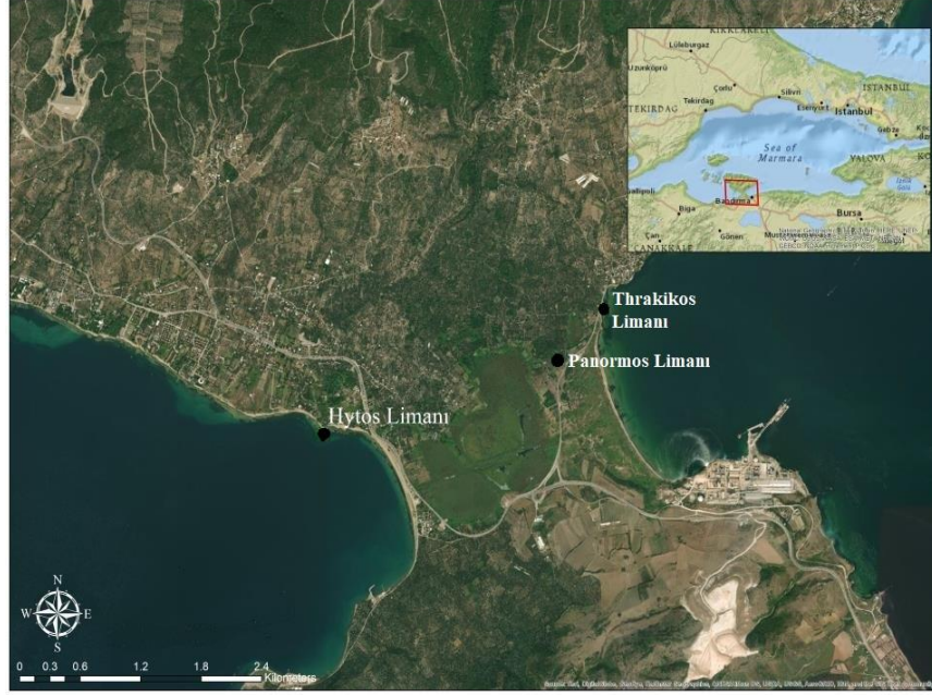
Harita-1: Kyzikos Kentinin Limanları (Gündüz, 2021: 642)

Panormos Limanı. Kyzikos'a bağlı bir liman olan Panormos Limanı, Arktonnesos Yarımadası'nın güneyinde ve Thrakikos Limanı'nın batısında lokalize edilmektedir (Apollonius, Argonautica , 1.954 vd.; Sayar, 2018: 262; Hasluck, 1910: 3; Munro ve Anthony, 1897: 158; Arslan, 2007: 323; Türk, 2008: 88; Korkmaz ve Has, 2014: 261). Kyzikos limanlarının en geniş ve önemlisi olan Panormos Arktonnesos'un güneyinde anakaraya en yakın noktada yer alıyordu ve hem Bandırma Körfezi hem de Erdek Körfezi tarafından gelen gemilerin yanaşabileceği bir konumda bulunuyordu (Rustafjaell, 1902: 181; Munro ve Anthony, 1897: 158; Korkmaz ve Has, 2014: 261). Ticari faaliyetlerin merkezi olan Panormos, kentin iç limanı olarak da bilinmektedir. Arazinin doğal yapısına uygun olarak inşa edildiği anlaşılan liman günümüzde sazlık ve bataklık bir alan içerisinde bulunmakta olup büyük oranda toprak altında kalmıştır (Yaylalı, 1991: 179; Korkmaz ve Has, 2014: 261 ve 268, res. 9). Alanda ele geçen buluntular, dalgakıran kalıntıları ve sur duvarları dikkatlice incelendiğinde limanın varlığı anlaşılabilir (Şahin ve Gündüz, 2010: 181; Korkmaz ve Has, 2014: 268, res. 10; Korkmaz ve Has, 2017: 107).