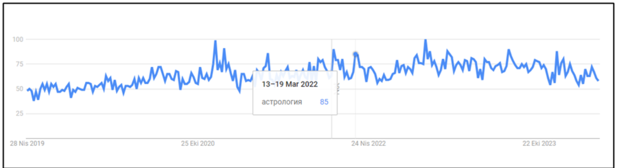
Şekil 4. Astroloji kelimesinin Rusya’da son 5 yıl içinde aranma oranı

tarihinde başlayan Rusya-Ukrayna savaşı her iki ülkede de astrolojiye olan ilgiyi arttırmıştır. Öyle ki savaşın başlangıcını takiben astroloji kelimesinin aranma oranı Rusya’da 85’e, Ukrayna’da ise 74’e yükselmiştir.