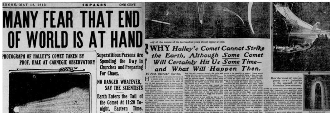
Kaynak: (Many fear that end of World is at hand, 1910; Serviss, 1910).

Eski dönemlerde insanların göksel olaylara ilişkin taşıdıkları korkulardan beslenen astroloji haberleri günümüze gelindiğinde salgın hastalıklardan ülke meselelerine, doğal afetlerden iklim krizine kadar çeşitli güncel korkulardan yola çıkılarak hazırlanmaktadır.