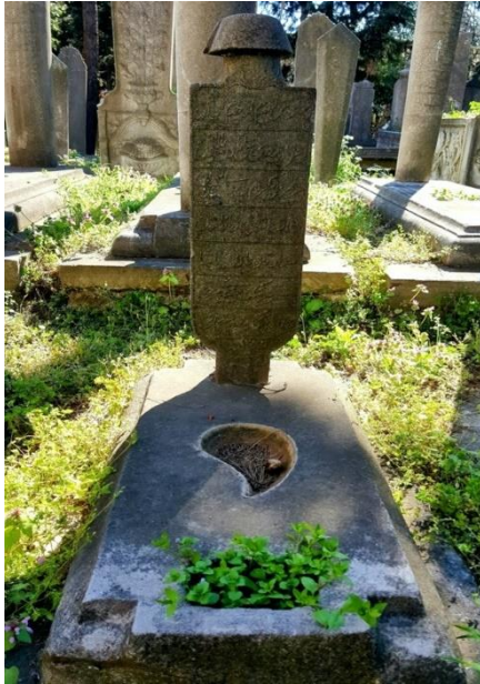
Foto.12. Üsküdar Büyük Selimiye cami haziresinde çocuk yaşta ölümü ile ailesini yasa boğan Malik Paşa'nın Torunu Mazlum Bey'e ait mezar taşı.