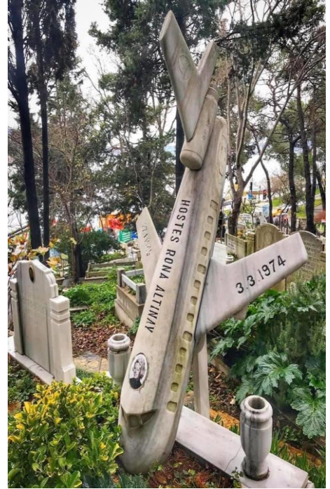
Foto 4: Havacılık tarihinin en büyük kazasında hayatını kaybeden Hostes Rona Altınay'ın İstanbul Aşiyân mezarlığındaki, düşen uçak şeklinde yapılmış mezar taşı. (URL-6)