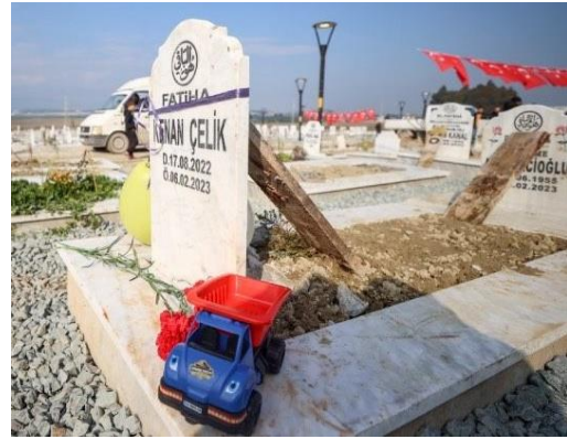
Foto 11: Deprem sonucunda vefat etmiş çocukların mezarlarına bırakılan eşyalar. (URL-15)