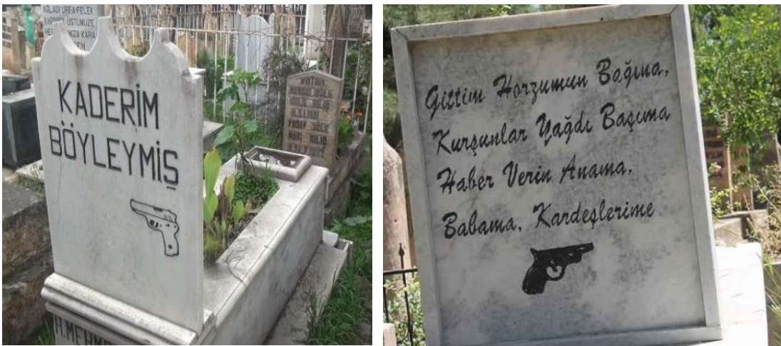
Foto.6: Cinayete kurban gidenlerin mezar taşlarında yer alan tabanca figürü. Şanlıurfa Bediüzzaman Mezarlığı (Foto. Mutlu Özgen Arşivi)