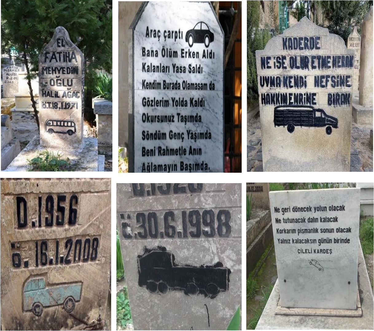
Foto 5: Trafik kazalarında hayatını kaybedenlerin mezar taşlarından Örnekler -Şanlıurfa Bediüzzaman Mezarlığı