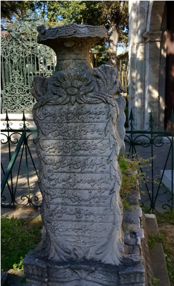
Foto.8: Üsküdar Büyük Selimiye Camii haziresindeki Amansız hastalığın pençesinden kurtulamayan H.1252 / M.1836 Muharrem ayında göçen Hayriye'nin mezar taşı.