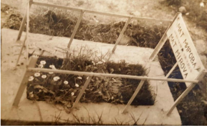
Foto.10: İstanbul Beylerbeyi'ndeki Küplüce Mezarlığı'nda Rus çocuk mezarı. (İHKKA:1024).