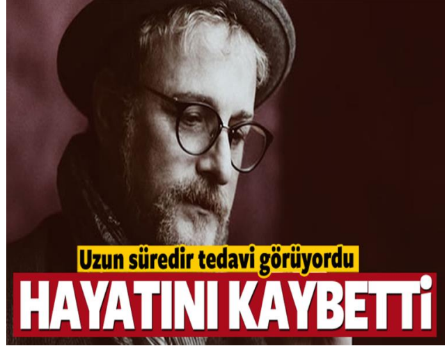
Foto 3: Sıcak Gelişme” veya “Flaş Haber” başlıklarıyla sunulan Basında çıkan Ünlülerin Ölüm Haberi Örnekler (URL-13 / URL-14)