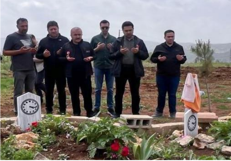
Foto.7: Adıyaman'ın Gölbaşı ilçesinde 6 Şubat Depreminin gerçekleştiği saat 04.17'nin işlendiği mezar taşı örneği