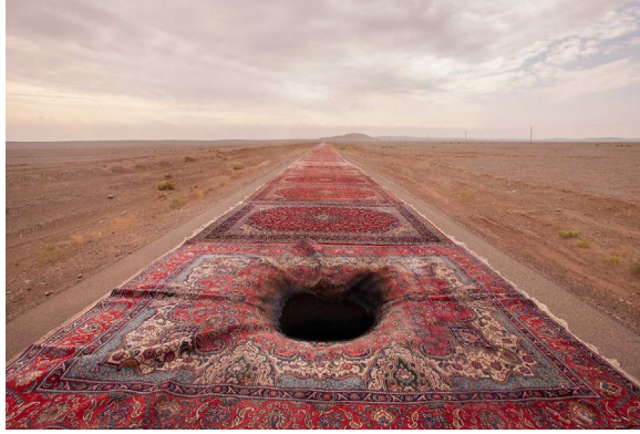
Resim 5. Kırmızı Bölge, 2013-2015 (URL-12)

“Kırmızı Bölge” (Resim 5) serisinde, kilimlerle kaplanmış yollar, izleyiciyi zorlu bir yolculuğa çıkarmaktadır. Bu yollar, kara delik gibi engellerle dolu, belirsiz ve tehlikeli bir geleceğe doğru uzanmaktadır. Çölün ortasında sonsuz bir şekilde uzanan bu yol, tüm nüfusun mücadelelerini ve zorluklarını yansıtmaktadır. Sanatçının kompozisyonları izleyicilere Orta Doğu’da yaşanan krizlerin evrensel boyutunu sunarak duygudaşlık kurmalarını sağlamaktadır.