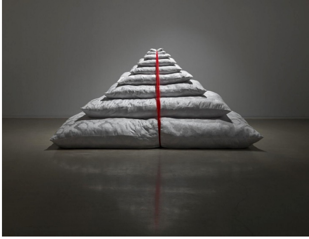
Resim 2. Dokuz Gece, Dokuz Yatak, 2016, Faig Ahmed (URL-10).

Sanatçının “Dokuz gece” isimli çalışması aynı zamanda, hamilelik döneminin yanı sıra, bir bebeğe doğduğunda verilen küçük yastıktan, evlendiğinde çeyiz olarak sunulan evlilik yatağına kadar bir kadının hayatının belirlenmiş aşamalarını ifade etmektedir. Arketip mezar şeklinde yapılan eser, ölüm duygusunu etkili bir şekilde yaşamın başlangıcına dâhil etmektedir. Ataerkil aileyi ve genç gelinini temsil etmektedir.