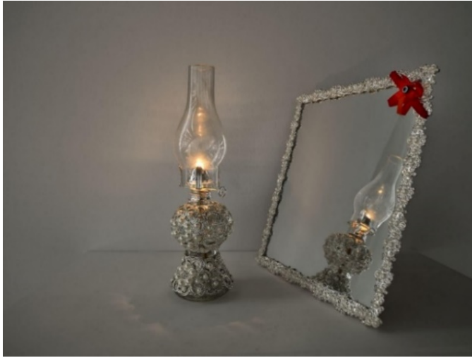
Resim 3. Gaz Lambası. Faig Ahmed (URL-10).

(Resim 3)’teki düzenlemeye bakıldığında gaz lambası ayrıntılı süslemeleriyle dikkat çekerken yanındaki ayna ve kırmızı kurdele gibi unsurlar çağdaş bir yorum ile evliliğe giden genç kızın yolunu göstermektedir. Gaz lambası ve ayna metaforu bu süreci tanımlamaktadır (URL-3). Faig Ahmed’in yaklaşımı, geçmişin estetik değerlerini korurken, onları modern dünyada nasıl yeniden yorumlayabileceğimiz konusunda örneklerdir.