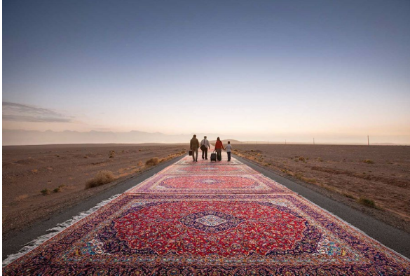
Resim 6. Kırmızı Bölge, 2013-2015 (URL-13)