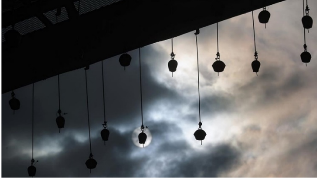
Resim 10. Sayanın Sesi, 2022, Betül Kotil (URL-16)

teknik bir unsur olarak işlev görürken diğer yandan bu pratiğin kültürel ve duygusal boyutlarını da yansıtmaktadır. Bu açıdan eser, bir etnografik belge niteliği taşımakta ve Anadolu kültürünün önemli bir parçasını görünür kılmaktadır. Halk kültürü açısından bakıldığında saya ve ziller, Anadolu'nun yerel halkının günlük yaşamının ayrılmaz bir parçasıdır. Bu unsurlar, köy yaşamının dinamiklerini, ritüellerini ve toplumsal ilişkilerini anlamak için anahtar rol oynamaktadır. Geçmiş ve yaşam bağlamında, "Sayanın Sesi" hem bireysel hem de kolektif anıların bir sembolüdür. Hafıza ve hatıra ile ilişkilendirildiğinde "Sayanın Sesi", bireylerin ve toplulukların geçmişe dair anılarını ve bu anıların kamusal alanda nasıl temsil edildiğini ele almaktadır. Eser, kişisel ve toplumsal hafızayı canlandırmaktadır. Betül Kotil'in "Sayanın Sesi" adlı eseri, Anadolu'nun kırsal yaşamından gelen kültürel öğeyi modern sanatın parçası haline getirerek, etnografya, halk kültürü, geçmiş, yaşam, hafıza ve hatıra gibi kavramlarla derinlemesine ilişki kurmaktadır. Kotil'in çalışmaları, sanatın sadece estetik bir nesne değil aynı zamanda kültürel bellek, toplumsal diyalog ve mekânsal etkileşim aracı olduğunu vurgulamaktadır (Bulovalı, 2022).