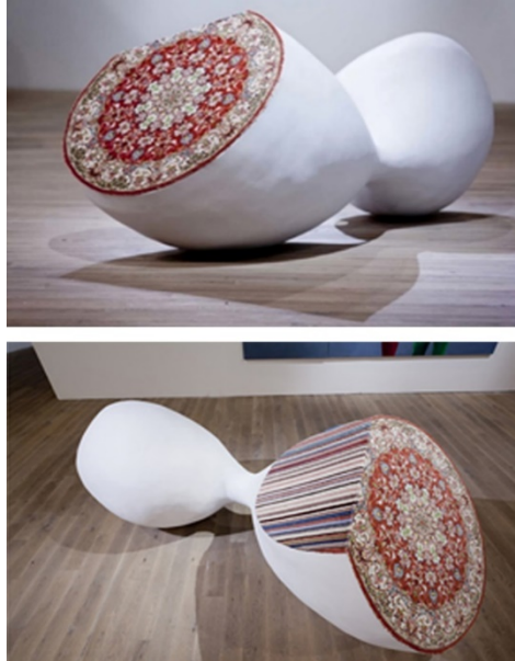
Resim 1. Bölüm, 2011, Faig Ahmed (URL-9).

Sanat duyuları genişletmek için bir araçtır, Ahmed de onu paylaşmanın aracı olarak, farklı teknikler deneyerek bunları mistik uygulamalar ile ilişkilendirmektedir. Sanatçının çalışmaları, geçmişi geleceği ve modernliği birbirine bağlayan bir köprüdür (URL-6). Faig Ahmed, Azerbaycanlı çağdaş sanatçı, müzelerde sergilenen ve etnografik nesne olarak tanımlanan geleneksel halıları kullanarak, bu kültürel nesnelere heykel ve halı sanatının modern perspektifi ile yeniden yorumlamaktadır. (Resim 1) Ahmed'in eserlerinde sıkça karşılaşılan motif, geleneksel halıların bozulmuş ve dönüştürülmüş halleriyle ilgilidir. Sanatçının eserlerinde halının temel özelliklerini koruduğu ve bu özelliklerin eserlerin anlamında belirleyici olduğu ifade edilmektedir. Sanatçı, dokuma tekniği, malzeme ve halının kenarındaki püsküller gibi özellikleri kullanarak eserlerini bir tür halı olarak yorumlanabilir kılmıştır. Halının işlevselliği bu eserlerde önemli bir yer tutmakla birlikte, bazı durumlarda bu işlevselliğin ötesinde anlam katmanlarıyla dolu bir sembol olarak da değerlendirilmektedir. Yani, bu eserler halı olarak algılanabilir ve halının tüm sembolik dilini kullanarak anlamını inşa ederler. Ortada bir gerçeklik vardır ki bu eserler halıdır ve halının tüm sembolik dilini kullanmaktadır (Baydemir, 2022).