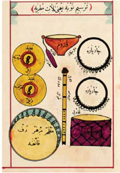
Fotoğraf 12: Eski nazariyat kitaplarında çarpâre ve halile görüntüsü

Eski nazariyat kitaplarında tarikatlarda kullanılan mûsikî aletleri Fotoğraf 7’deki gibi resmedilmektedir. Halile, zil ile Çârpâre-çârlpâre enstrümanının fotoğrafı yer almaktadır. 35 Dikkat çekici olan çarpâre enstrümanını günümüzdeki arbane enstrümanına benzer şekilde resmedilmiştir.