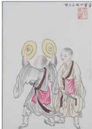
Fotoğraf 6: Budist manastırlarında ritüellerde kullanılan zilleri tasvir eden çizimler