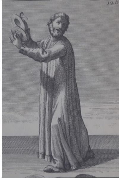
Fotoğraf 10: Filippo Bonanni'nin Gabinetto Armonico 'su da bir gravür

18. yüzyıl kaynaklarından olan Filippo Bonanni'nin Gabinetto Armonico 'su da bir gravür derlemesidir. Baştan sona saz gravürleri ile resimlenen, sazlar hakkında tanıtıcı bilgilerden oluşan eser ilk kez 1716'da yayınlanmış, 1723'te genişletilip tekrar gözden geçirilmiş yeniden basılmıştır. Kitapta farklı ülkelerin eski ve yeni sazlarının yanı sıra Türk mûsikisinde yer alan enstrümanlardan bazılarının gravür çizimleri yer almaktadır. Bu gravür çizimleri içerisinde zil de yer almaktadır. Fakat bu zili Ermeni zili olarak isimlendirmiştir. 24 Zil, Türk halk mûsikîsi enstrümanlarından metal çarpmalılar sınıfında yer almıştır. 25