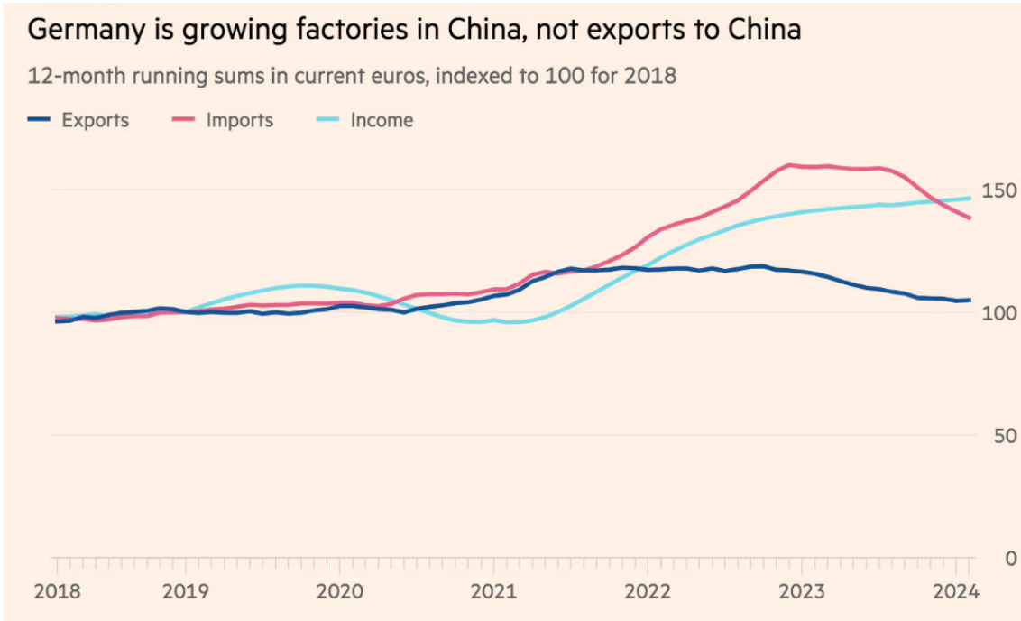
Grafik 2. Almanya'nın Çin'deki Sanayi Yatırımları Getirisi