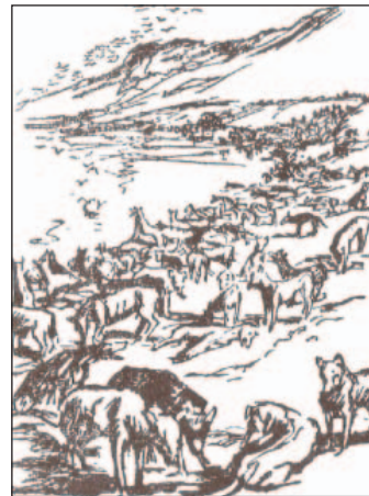
Resim 4: Georges Goursat'ın Fransa'da “Journal” gazetesinde yayımlanan Hayırsız Ada'daki köpekler ile ilgili karikatürlerinden biri (1)