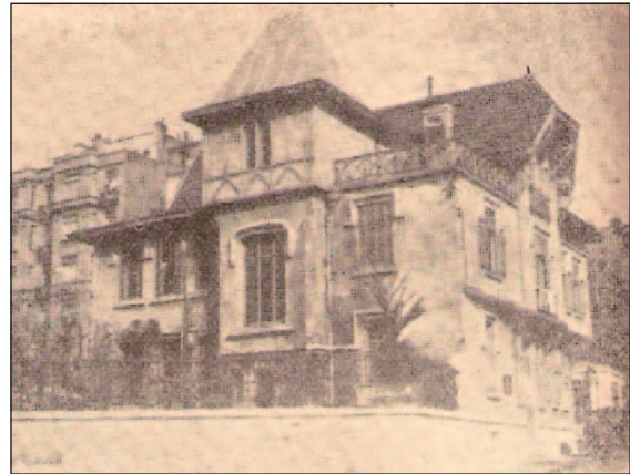
Resim 8: Türkiye Hayvanları Koruma Derneğinin merkez binası ve hayvan hastanesi