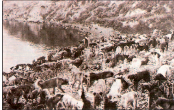
Resim 2: Hayırsız Ada'ya gönderilen köpekler 16 Figure 2: Dogs which were sent to Hayırsız Ada