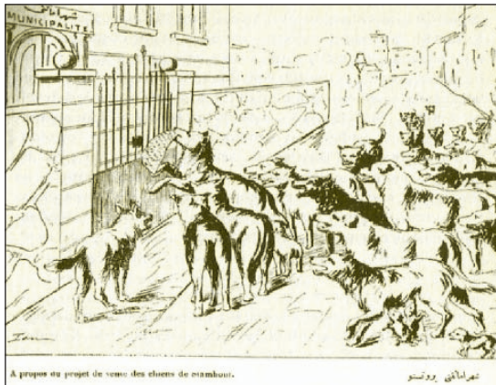
Resim 3: “Şehremânetine protesto” başlıklı karikatür 17 Figure 3: The caricature named “Protest to municipality”