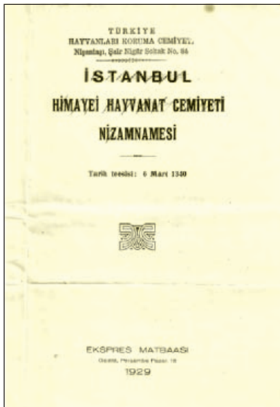
Resim 7: İstanbul Himaye-i Hayvanat Cemiyeti Nizamnamesi (1929)