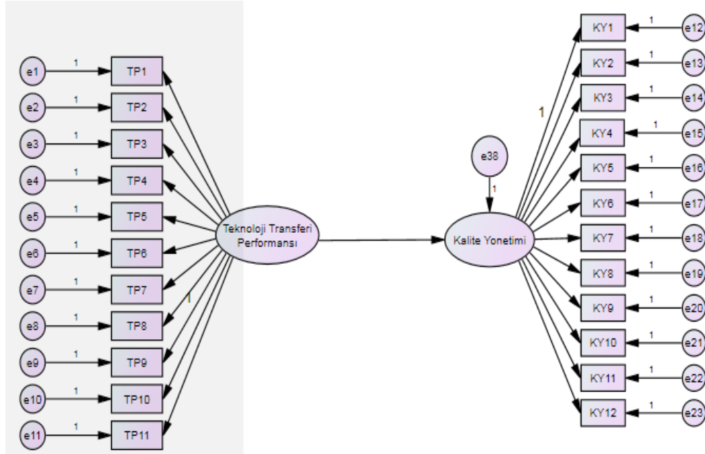
Şekil 2. Yapısal model ve ölçüm modelinin yer aldığı yol diyagramı.

Araştırmanın modelindeki değişkenlere ait yapısal model ve ölçüm modelinin yer aldığı yol diyagramları Şekil 2'de gösterilmiştir.