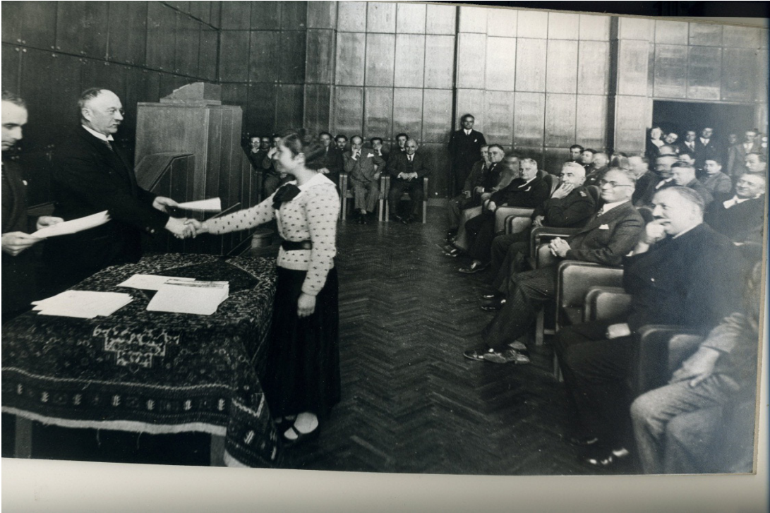
Şekil 2: Yüksek Ziraat Enstitüsü, kayıt ve ant içme töreni (1936)