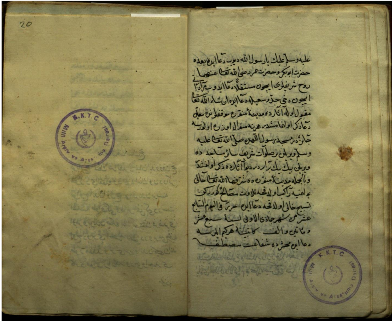
Halîm-zâde Alî el-Lefkoşevî el-Kibrîsî. Menâsikü'l-Hac . Lefkoşa: Kuzey Kıbrıs Türk Cumhuriyeti Milli Arşiv ve Araştırma Dairesi, Türkçe Yazmalar Koleksiyonu, II. Mahmud Ktp. 759. 19b.