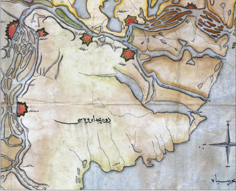
Osmanlı Döneminde Dobruca Ovası