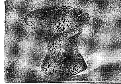
Keramik Koç Başı : Env. no: 4089.

Beyaz hamurlu, mavi-beyaz, şeffaf sırlı, boynun üst kısmı ile başı, bacakları göğüs ve kalçadan kopuk ve noksan, sırt ve kalçada kırık ve darbeler mevcuttur. Figürün aksesuarı mavi renk ile işlenmiştir. Sol kalça ile göğüste lâcivert renk ile işlenmiş madalyon şeklinde birer nebati motif bulunmaktadır. Figürin 16. yüzyıla aittir.