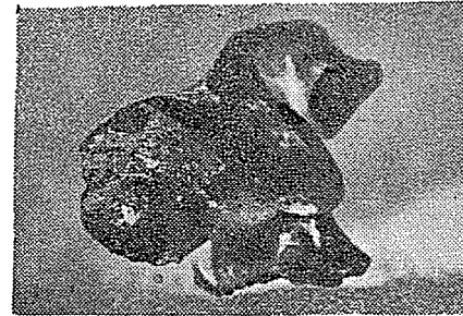
Koç Figürin Başı : Env. no: 4091.