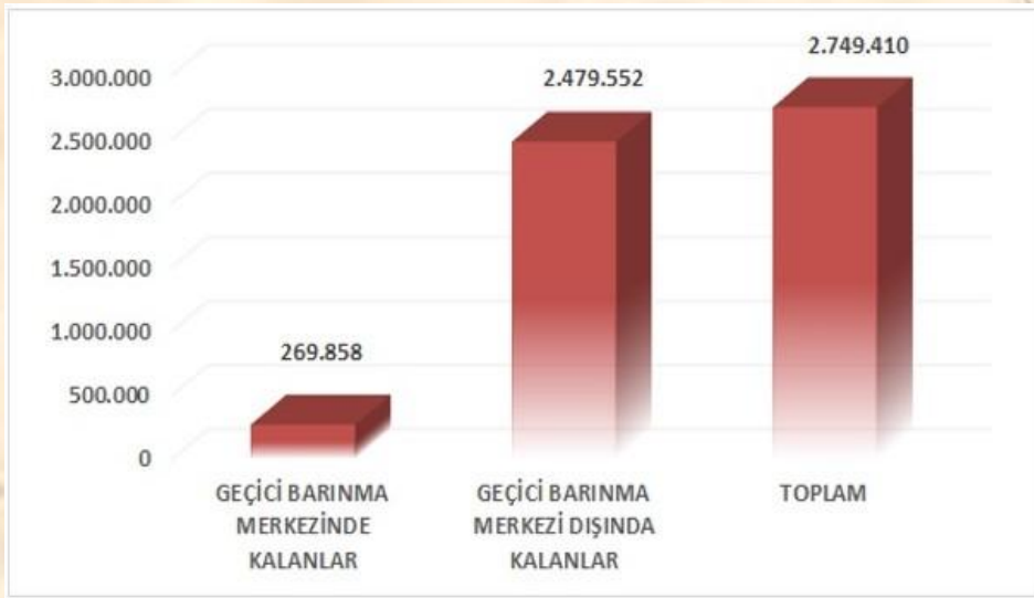
Grafik 1: Geçici Barınma Merkezleri İçinde ve Dışında Kalan Suriyeliler

Suriye’de uzun süren iç savaş sadece Suriye’yi değil Suriye’ye komşu olan Türkiye, Ürdün ve Lübnan gibi ülkeleri de büyük ölçüde etkilemiştir. Milyonlarca insan bu iç savaş nedeniyle ülkelerinden, Suriye’ye komşu ülkelere, oradan da Avrupa ülkelerine göç etmek zorunda kalmıştır. Bu iç savaş nedeniyle Türkiye Cumhuriyeti İçişleri Bakanlığı Göç İdaresi Genel Müdürlüğü verilerine göre 31.03.2016 tarihi itibariyle Suriye’den Türkiye’ye toplam 2.749.410 Suriyeli sığınmacının geldiği, Bu sığınmacıların 2.479.552’inin geçici korunma merkezleri dışında, 269.858’i ise geçici koruma merkezlerinde kaldığı belirtilmektedir (Grafik 1).