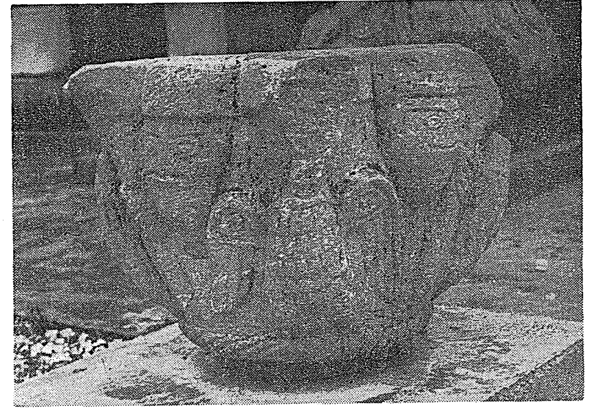
Resim 1. Tire Müzesi'ndeki 147 env. no.lu sütun başlığı.