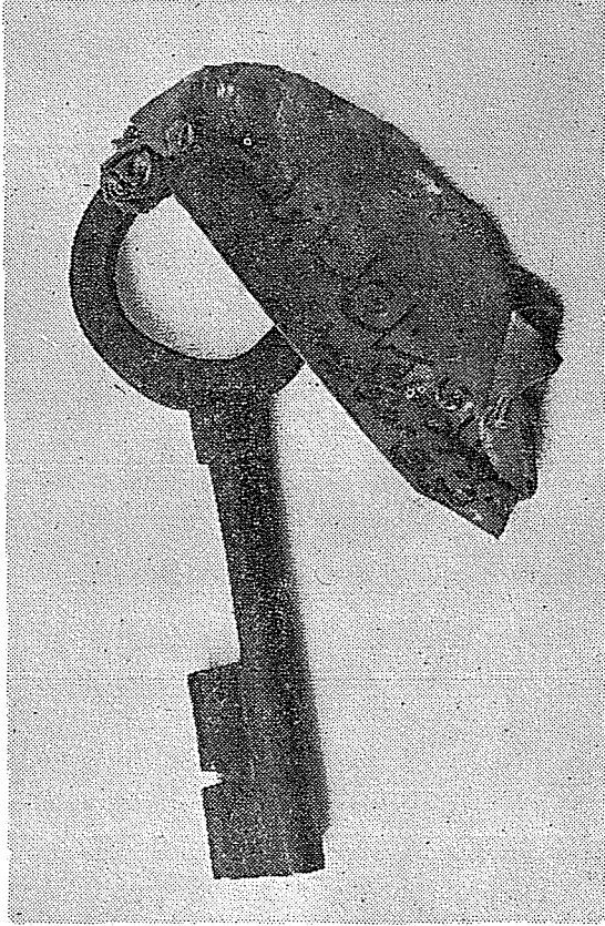
Resim 19. Belgrat Kalesi'nin İstanbul kapısı anahtarı.