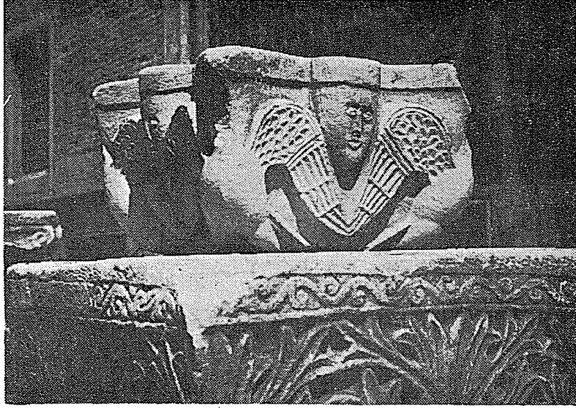
Resim 3. İstanbul Arkeoloji Müzesi'ndeki 4722 env. no.lu sütun başlığı.