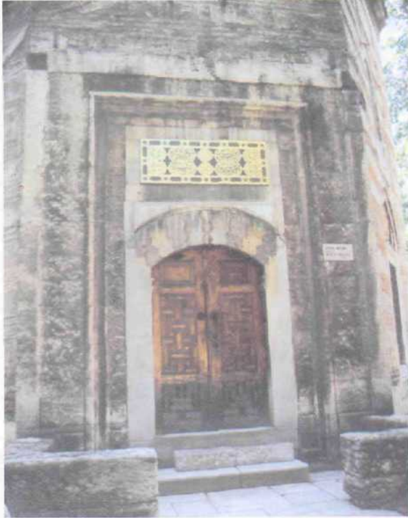
2. Resim : Bursa, Şehzade Mustafa Türbesi, Taçkapı Bloku.