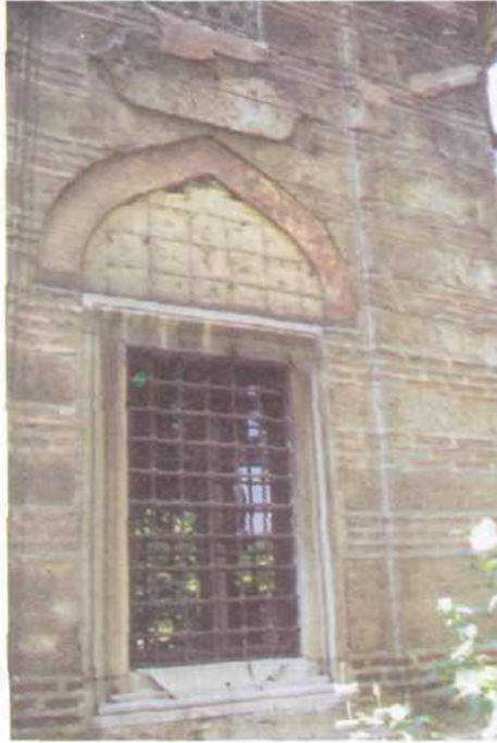
6. Resim : Bursa, Şehzade Mustafa Türbesi, Girişin Sol Tarafındaki Pencere Alnlığı Çini Kaplama İzleri.