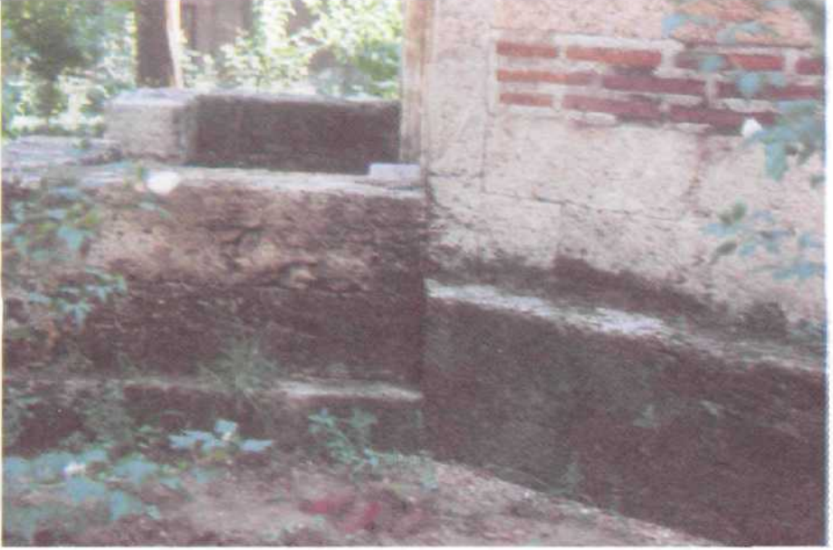
3. Resim : Bursa, Şehzade Mustafa Türbesi. Ta^kapı Blokuyla Bütünlük Gösteren Subasmamn Batıdan Görünüşü.