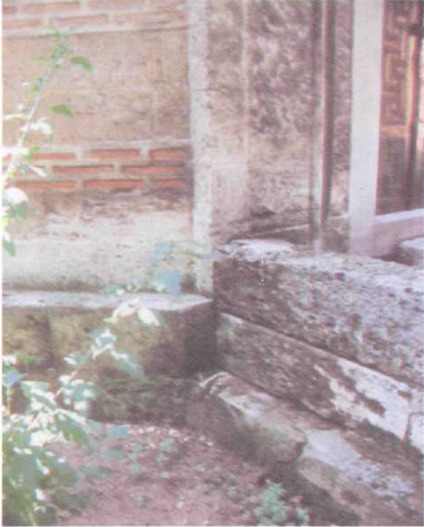
4. Resim : Bursa, Şehzade Mustata Türbesi, Taçkapı Blokuyla Bütünlük Gösteren Subasmamn Doğudan Görünüşü.