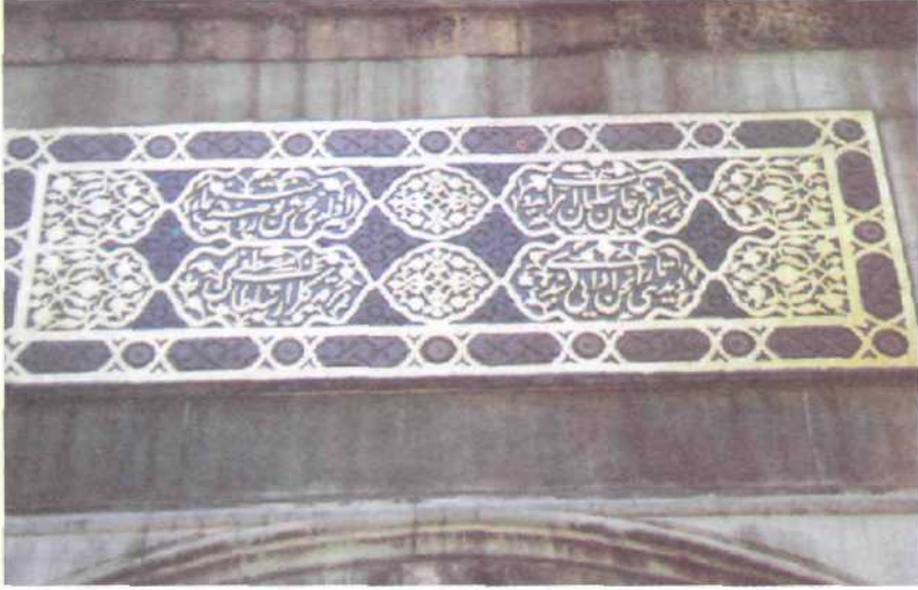
5. Resim : Bursa, Şehzade Mustafa Türbesi, Kitabe Çerçevesindeki Çini Kaplama İzleri.