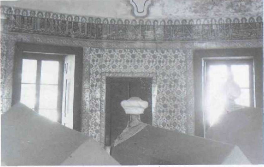
1. Resim : Bursa, Şehzade Mustafa Türbesi, İpteki Çını Kaplam ti.