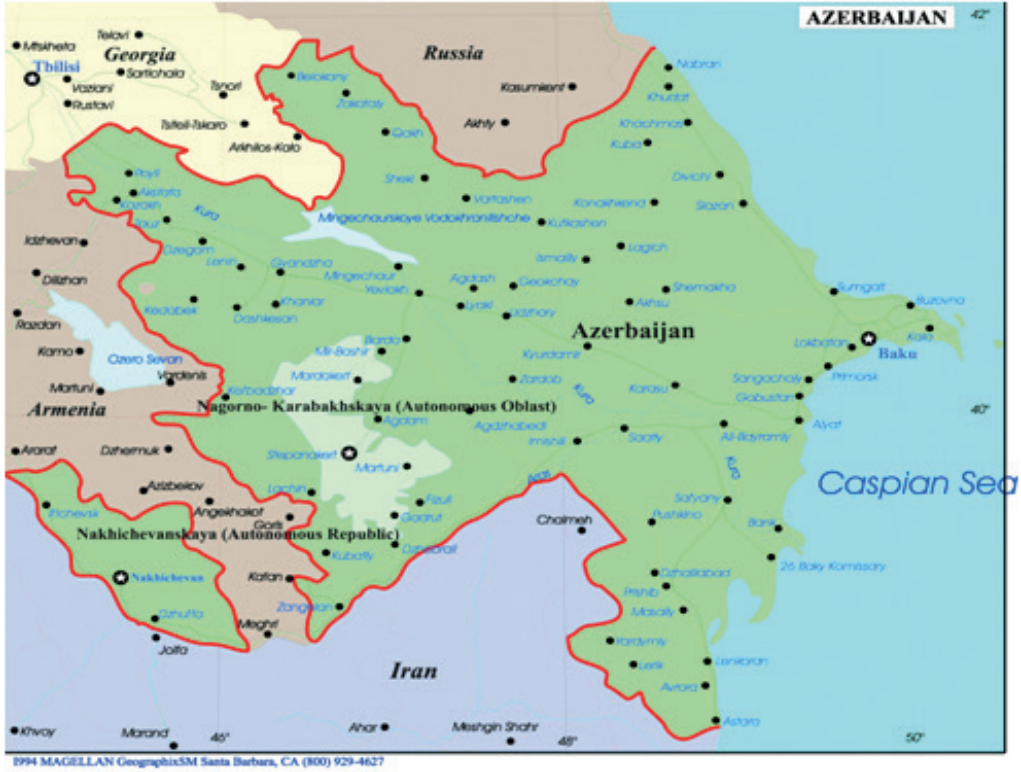
Resim 1. Azerbaycan Coğrafi Haritası

“Belirli bir bölgede ya da belirli bir bölgede yaşayan bir toplum tarafından kullanılan diller, dillerin çeşitliliği, bölgesel değişkelerinin olup olmaması, dillerin genetik olarak yakınlık ya da uzaklığı, konuşur sayısı, dillerin işlev alanları, hukuksal olarak konumları ve ilişkileri, nasıl bir hiyerarşi içinde buldukları, toplumun bireylerinin dillerin saygınlığı hakkındaki değerlendirmeleri gibi ölçütler o topluluk ya da bölgedeki dil durumunu belirler” (Killi Yılmaz 2016: 245).