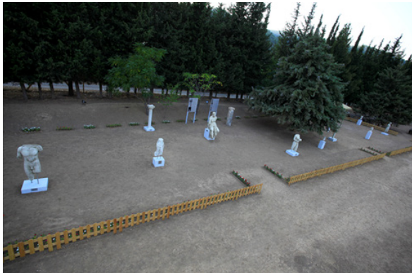
Resim 2. Klaros Ören Yeri Arkeopark Alanı

Klaros Kutsal Alanı'ndaki arkeopark uygulamasının, koruma, rekreasyon ve miras yönetimi