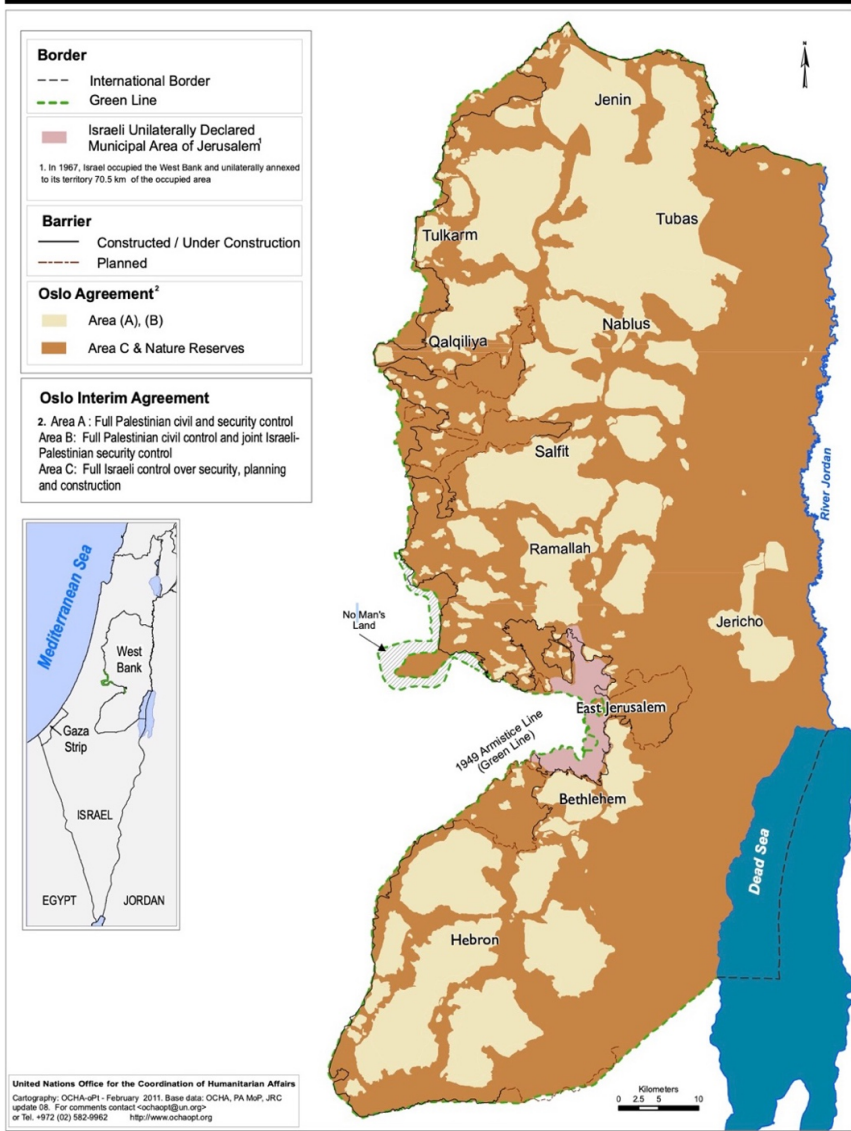
Şekil 3: Batı Şeria. Açık Kahverengi A ve B, Koyu Kahverengi C Bölgesi (BM-OCHA, 2011).