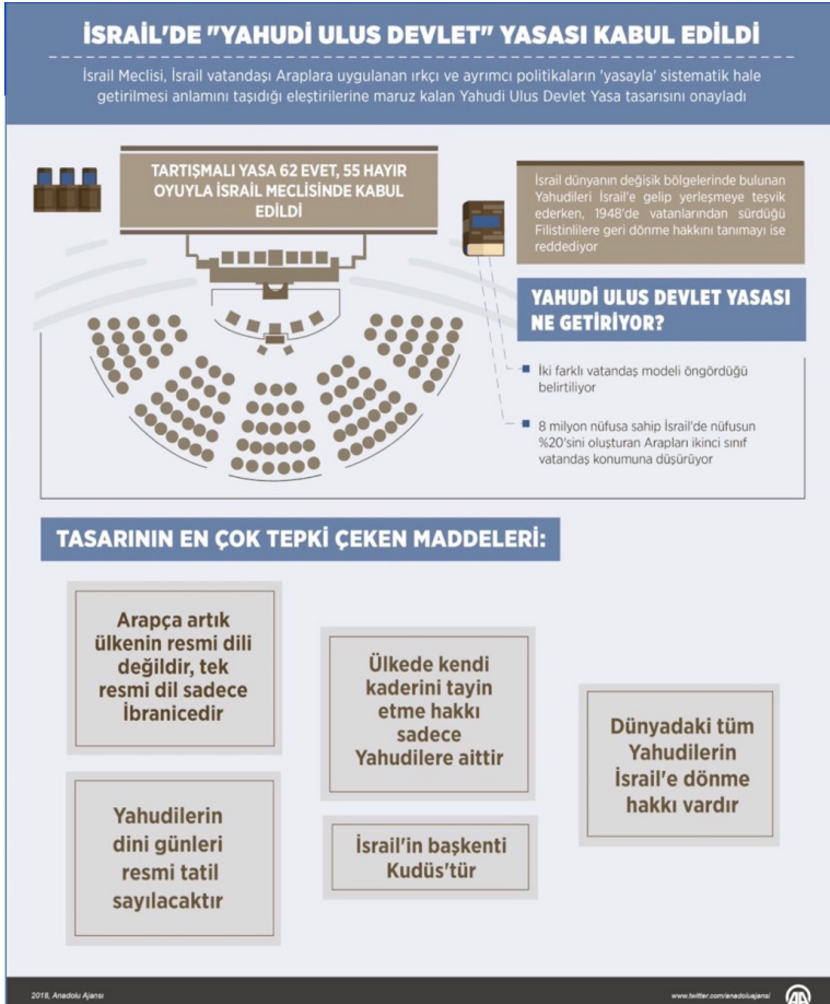
Şekil: 1 (Yiğit, 2018)

Bu yasada çok sarih bir biçimde görüldüğü üzere İsrail vatandaşları Filistinli Araplar ikinci sınıf vatandaş muamelesi görmektedir. İsrail apartheid rejiminde Yahudiler millet ( le'um ) addedilirken Araplar vatandaş ( ezrahut ) olarak sınıflandırılmaktadır. Yahudi milletinden bir kişi yabancı bir eşle evlendiğinde eşi İsrail'de oturma izni alabilirken Arap bir vatandaş yabancı biriyle evlenmesi durumunda eşini İsrail'e getirememektedir (Falks - Tilley, 2017).