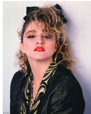
Resim 3: Madonna