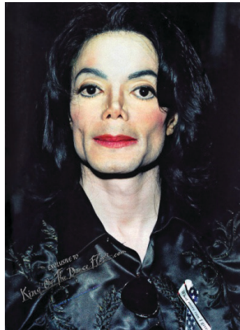
Resim 2: Michael Jackson