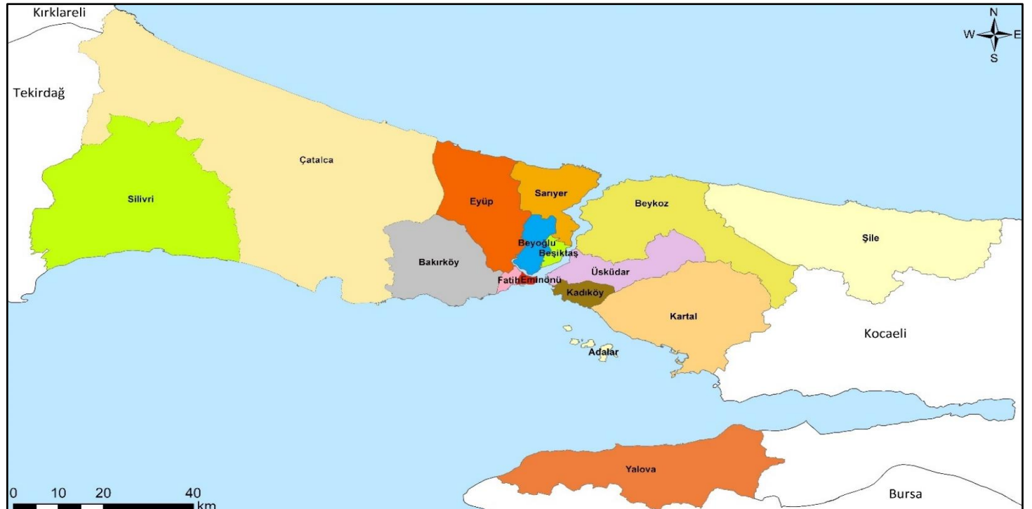
Şekil 3. 1950 Yılı İstanbul İli İdari Bölünüşü.

1945 yılında çıkarılan 4695 sayılı "Teşkilat-ı Esasiye Kanununun Sadeleştirilmesi" kanunu ile "nahiyeye" kavramı "bucak" kavramına dönüştürülmüştür (Şahin, 2006). 1970 yılından sonra da görev süresi dolan bucak müdürlerinin yerine yeni atama yapılmamış ve tedricen bucak idari teşkilatı pratikte ortadan kalkmıştır. Bucak teşkilatının resmi olarak kaldırılması ise 11.09.2014 yılında kabul edilen 5747 sayılı Kanunun 9. maddesindeki "Tüm illerde bucaklar kaldırılmıştır. Kaldırılan bucaklara bağlı belde ve köyler, bucağın bağlı olduğu idari birime bağlanmıştır." ifadesiyle gerçekleştirilmiştir.