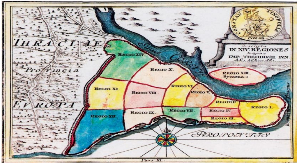
Şekil 2. Konstantinopolis'in V. yüzyıla ait idari bölünmesi.

varlığını sürdüren Byzantion, M.S. 196 yılında Roma İmparatorluğu'nun kenti durumuna gelmiştir. M.S. 330 yılında Roma İmparatoru Konstantin, Byzantion'u doğuda Roma'ya eş başkent ilan ederek adını "Konstantinopolis" olarak değiştirmiştir (Kuban, 1970, s. 28). Bu tarihten sonra üç kıtaya hükmeden bir imparatorluğun merkezi olan İstanbul dünya ölçeğinde bir şehir konumuna ulaşmıştır (Bozlağan, 2012). Konstantinopolis bu dönem Roma'daki idari bölünmeye uygun olarak 14 bölgeye ayrılırken (Keçiş, 2015) bu on dört bölgenin idari sınırlarını şehrin topografyasına uygun olarak ortaya çıkan ana yollar oluşturmuştur (Kuban, 1970, s. 28).