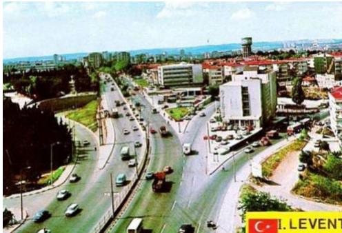
Resim 3: 1980 1. Levent

Tarihe adını altın harflerle yazdıran bu şehir günümüzde sürekli göç alması, bundan kaynaklanan çarpık kentleşme, belediyelerin bu hızlı artışa ayak uyduramaması, rant beklentileri ve daha birçok çıkar amaçlı atılan adımlar nedeni ile alt yapı sorunları başta olmak üzere büyük yaralar almıştır. Özellikle son 20 yıllık dilimde geçirdiği depremler, çağa ayak uydurma çabalarında adım başı yükselen inşaatlar (alışveriş merkezler, iş kuleleri, gökdelenler vb.) sayesinde her yer beton yığına dönmeye başlamış ve yeşil alan minimum derecede değerlendirilme noktasına gelmiştir.