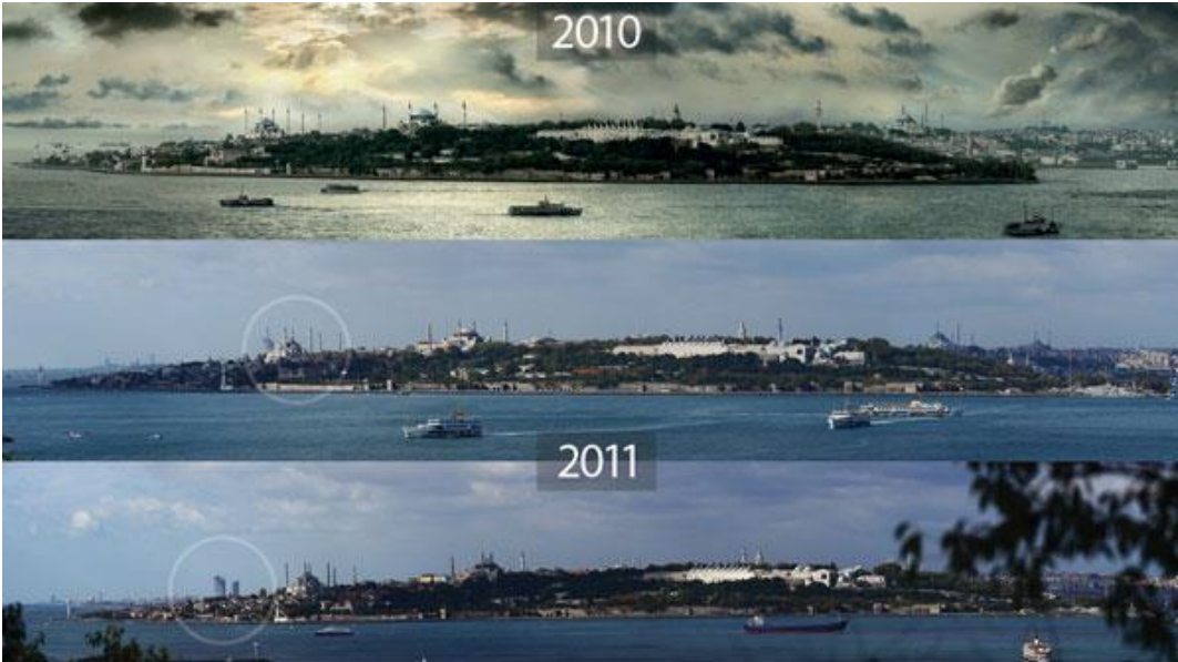
Resim 6: İstanbul Silüeti

Kültürel açıdan her geçen gün biraz daha kendini geliştiren şehir 2010 yılında “Avrupa Kültür Başkenti” seçilmiştir. Ayrıca Dünyaca ünlü pop starlar İstanbul stadyumlarını doldururken, opera, bale ve tiyatro gibi sanat dallarında eserler yıl boyu sahnelenir. Mevsimsel festival boyunca, dünyaca ünlü orkestralar, koral müzik grupları ve caz müziğinin efsane isimleri konser vermekteler. 1982 yılından beri düzenlenmekte olan Uluslararası İstanbul Film Festivali, Avrupa'daki en önemli film festivallerinden birisidir. Güzel sanatlarla ilgili olarak 3 yıldır İstanbul Bienali düzenlenmektedir. 1881