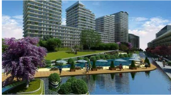
Resim 7: Dumankaya Mix