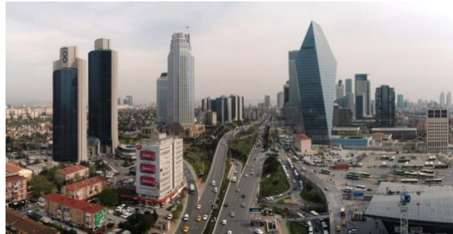
Resim 4: 2015 1. Levent

Oysaki 3 bin yıllık tarihinde hüküm süren Devletlerden kalan yapıları ile de (Surlar, Dolmabahçe Sarayı, Çırağan Sarayı, Topkapı Sarayı, Nuruosmaniye Cami, Mihrimah Sultan Cami, Ayasofya, Kapalı Çarşı vb. başta olmak üzere birçok mimari harikayı) yerini tarih kitaplarında almıştır.