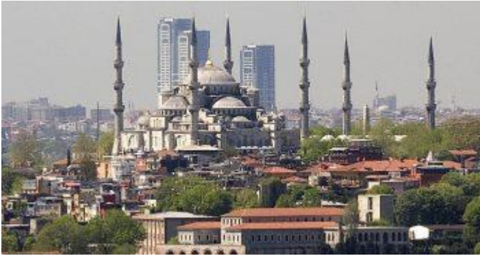
Resim 5: 16/9 isimli Projenin Görünüşü

Bununla birlikte Mimar Sinan' ın Selimiye Camisini tanımlarken kullandığı “Ustalık Eserim” kelimesinin tam karşılığı olarak ülkemizin kelimesinin tam anlamıyla hiç değişmeyen yükselen incisidir. İstanbul bünyesinde bulundurduğu onca tarihi yapı, iki kıtayı birbirine bağlayan köprüleri, eşsiz boğazı ile asırlardır süre gelen geleneği olan farklı dil, din, ırk ve mezhep göz etmeksizin bütün kullanıcılarına kapılarını ardına kadar açmaya devam etmektedir. Bununla birlikte Zeytinburnu semti deniz kenarında inşa edilen yapılar bu ustalık eserinin kazandırdığı ihtişamlı silüeti yok etmektedir.