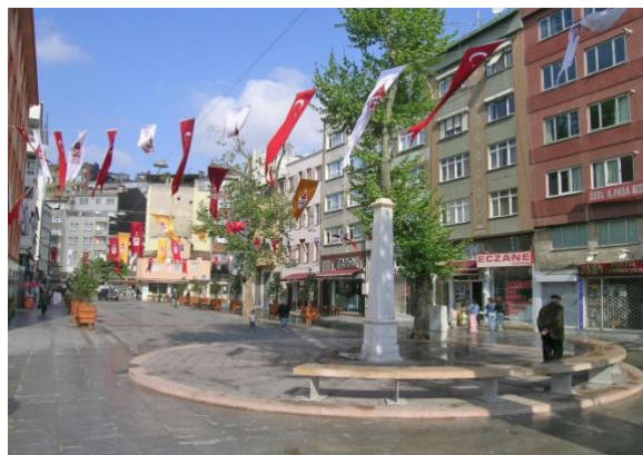
Resim2: 2017 Kasımpaşa Kızılay Meydanı

Kentleşme sürecinde ekonomik nedenlerle kırdan kente göç eden bireylerin öncelikle mevcut kent yapısı içinde emildiği ve kapasite fazlası göçlerde ise kentin dışına doğru taşarak gecekonduya taşındığı görülmektedir.