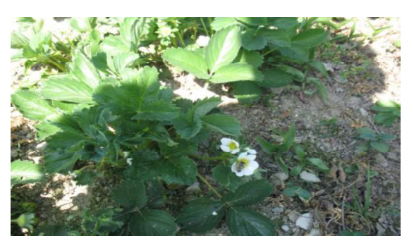
Şekil 1. Bal arısının çilek bitkisini ziyaret etmesi

Türkiye'de doğal veya kültürü yapılan yaklaşık 300 bitki türünün nektarlı olduğu ve arıcılık açısından önem taşıdığı bildirilmektedir (Sorkun, 1994). Bal arıları çiçekleri nektar ve polen toplamak amacıyla ziyaret etmektedir. Nektar, erginler için karbonhidrat kaynağı olmanın yanında bal yapımında, polenler ise daha çok yavrular için protein kaynağı olarak değerlendirilmektedir (Güler, 2006).