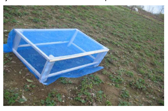
Şekil 4. 4 mm x 4 mm tül ile kaplı kafes