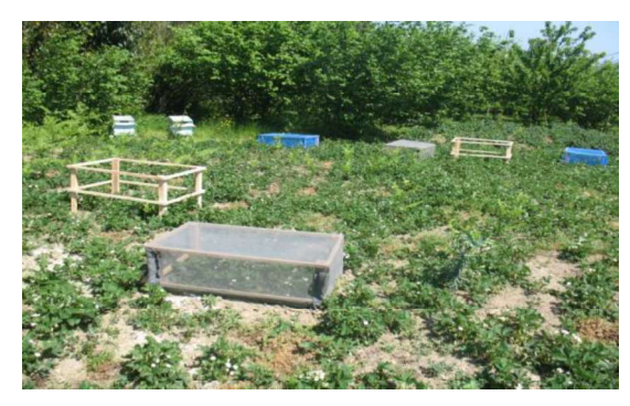
Şekil.2. Çilek bahçesinde kafesler ve arı kolonileri

Kontrol gruplarında çiçeklenme süresince 3 gün aralıklarla belirlenen alan üzerinde 10 dakika süreyle balarıları ve morfolojik olarak balarılarından büyük böcek sayımları yapılmıştır. Çilek meyvesi olgunlaştıktan sonra 3'er gün ara ile 7 kez meyveler toplanıp yerinde tartılmıştır. Tartım sonuçları 1 m² alan üzerinden hesaplanmıştır. Elde edilen verilere JAMP istatistikî paket programı uygulanmış, uygulamalar arasındaki fark önemli olduğunda LSD testi yapılarak gruplar belirlenmiştir.