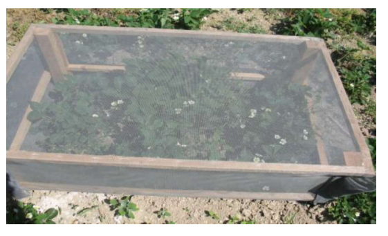
Şekil 3. 1 mm x 1 mm tül ile kaplı kafes