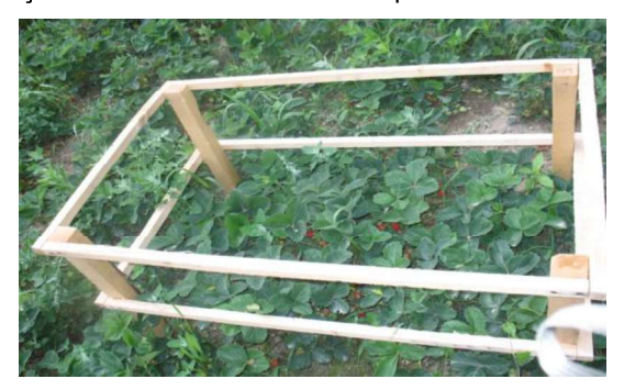
Şekil.5. 60 cm x 95 cm ebatlarında kafes