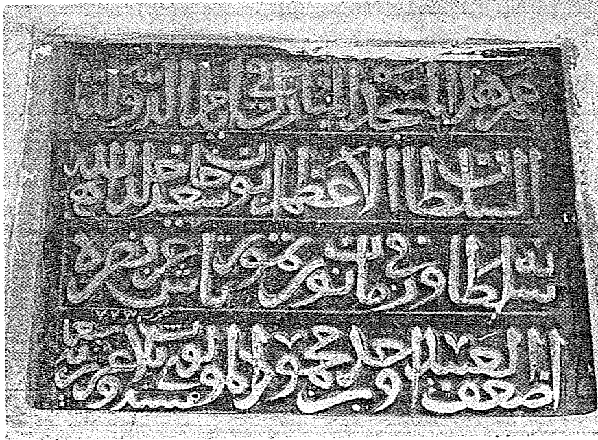
I. Kale-kapısı mescidi kitabesi (723/1323)