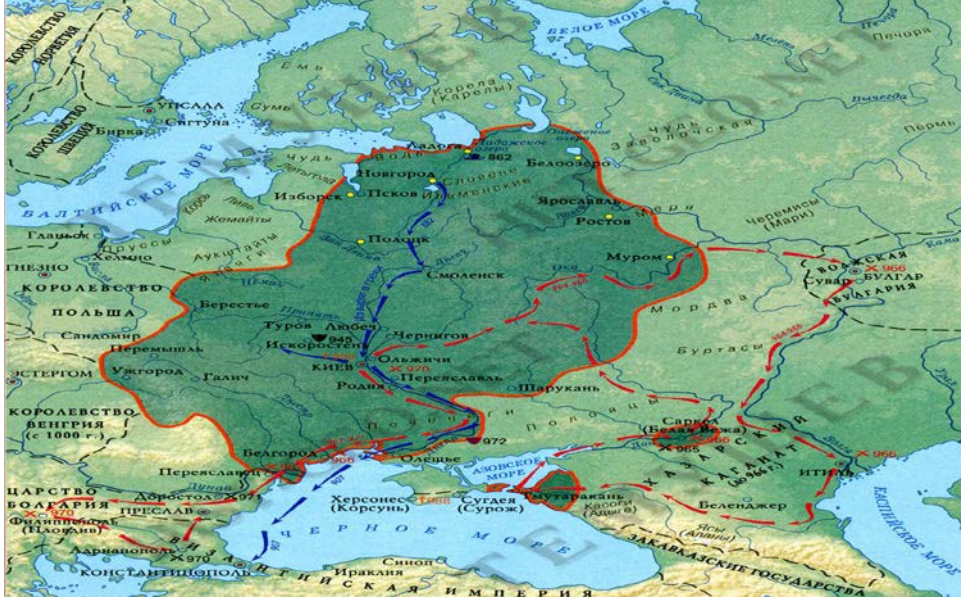
Resim 1: 862-1054 Yılları Arasında Kiev Rus Devleti 45

Bilge Yaroslav tarafından Kiev Rus devleti, belirli bölgelere ayrılarak oğulları arasında paylaştırılmıştır. Çocuk sayısına göre knyazlık sayısı artmış ve daha sonra Kiev Rus devleti, knyazlar arasında ortaya çıkan mücadeleler sonucunda parçalanmaya başlamıştır. 46 Bilge Yaroslav 76 yaşında iken 1054 yılında ölmüştür. 47 Bilge Yaroslav’ın