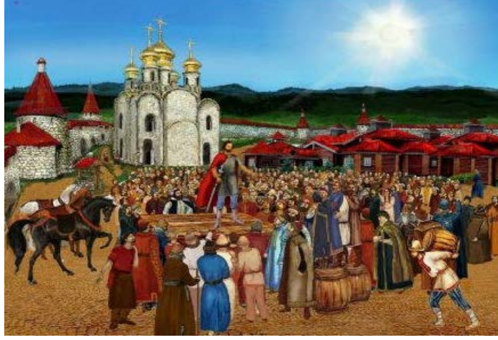
Resim 2: Temsili Veçe Toplantısı Görseli 87

Veçenin işleyişine bakıldığında bir yerde toplanan ve bir kalabalığı simgeleyen Resim 2'deki temsili veçe görseline göre; insanlar yüksek sesle konuşarak (bağırarak) kararların alınmasını sağlamışlardır. 88 Böylelikle veçelerde sesli bir şekilde yapılan itiraz ya da kabullerin, günümüz meclislerindeki karar alma süreçlerinin kökenleri olduğu düşünülebilir. Veçelerde azınlıkta kalanlar, çoğunluğun kararına uymuştur. Azınlığın karara uymaması durumunda görüş ayrılıkları sebebiyle tartışmalar yaşanmıştır. Bu süreçte zaman zaman zor kullanma, kargaşa ve istikrarsızlık sorunları sebebiyle tartışmalar olmuştur. Veçe içinde bazı fraksiyonlar ortaya çıkmıştır. Uyumsuzluğu çözmek için kişiler değil, birbirine karşıt topluluklar, çözüme yönelik tartışmışlardır. Anlaşma sağlanmadığı takdirde, gruplar arasında pek çok kez mücadele yaşanmıştır. Novgorod şehrinin siyasi hayatı bu şekilde ilerlemiştir. Novgorod şehrinde boyarlar, eski düzeni yıktıkları zaman veçe sistemi de ortadan kalkmıştır. Böylece boyarlar arasındaki çatışmaların artmasıyla Novgorod devletinin kurumsal olarak temelleri yok olmuştur. 89