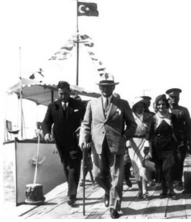
Fotograf 1. Mustafa Kemal Atatürk'ün Baltacı Çiftliği'ni Ziyareti

Yalova kaplıcalarında Gazi Mustafa Kemal Paşa'nın ikamet etmesi için Atatürk Köşkü inşa edilmiştir. Köşkün eşyalarının bir kısmı Milli Saraylar Müdüriyetinin depolarında bulunan eşyalardan karşılanmış bir kısmı da dışarıdan satın alınmıştır (BCA. 30.18.1.2, 13/51/15).