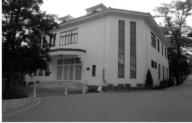
Fotograf 2. Atatürk Köşkü - Yalova

Yalova kaplıcalarında Gazi Mustafa Kemal Paşa'nın ikamet etmesi için Atatürk Köşkü inşa edilmiştir. Köşkün eşyalarının bir kısmı Milli Saraylar Müdüriyetinin depolarında bulunan eşyalardan karşılanmış bir kısmı da dışarıdan satın alınmıştır (BCA. 30.18.1.2, 13/51/15).