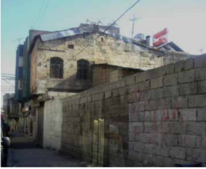
Resim 5: Kepkep Sokağına açılan 78 nolu parseldeki evin avlu duvarları (G. Gül, 2010)