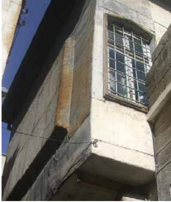
Resim 14: Doğudan Canoğlu Çıkması'na açılan 85 nolu parseldeki evin, sokağına çıkma yapan saçla kaplanmış cephesi (G. Gül, 2010)