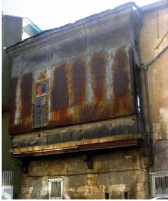
Resim 9: Kepkep Sokağına açılan 127 nolu parseldeki evin sokağına taşma yapan üzeri saç kaplı çıkması (G. Gül, 2010)