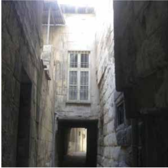
Resim 10: Canoğlu Çıkması'ndaki ahşap kirişleme sistemiyle örtülmüş kabaltının görünümü - kuzeye doğru bakış