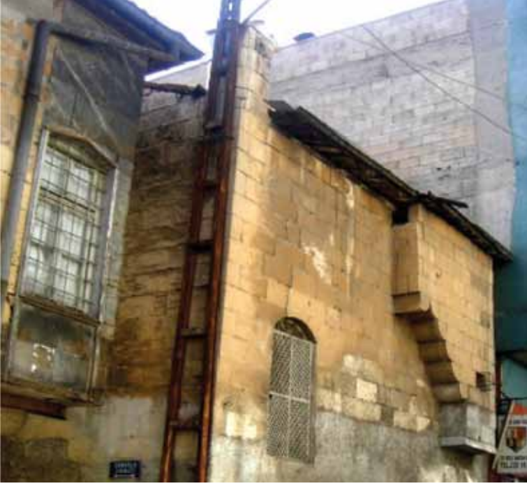
Resim 7: Kepkep Sokağına açılan 80 nolu parseldeki evin kuzey cephesi (G. Gül, 2010)