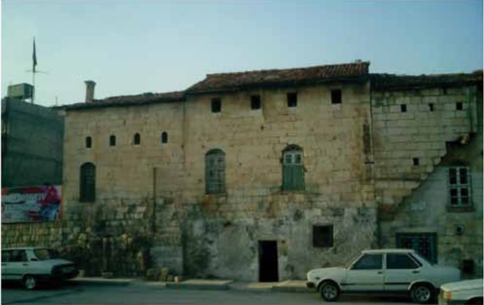
Resim 2: Dere Kenarı Sokağı'na açılan, sağdan sola doğru birbirine bitişik 120, 89 ve 88 nolu tescilli evler (G. Gül, 2010)