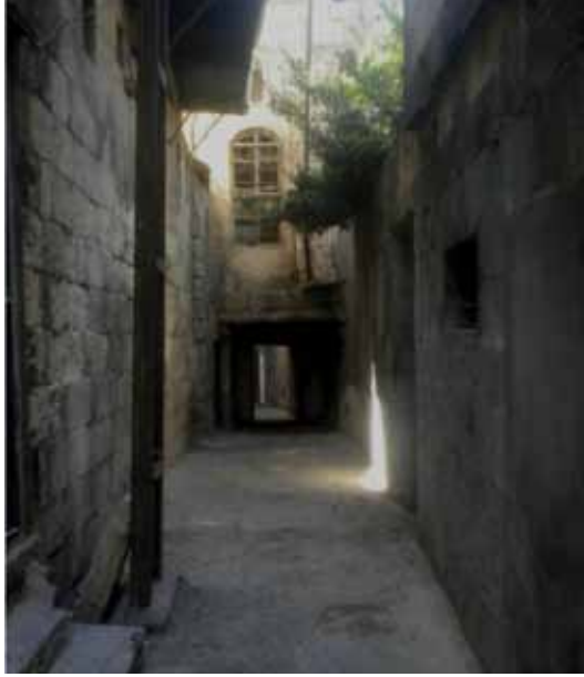
Resim 11: Canoğlu Çıkması'ndaki ahşap kirişleme sistemiyle örtülmüş kabaltının görünümü - güneye doğru bakış (G. Gül, 2010)