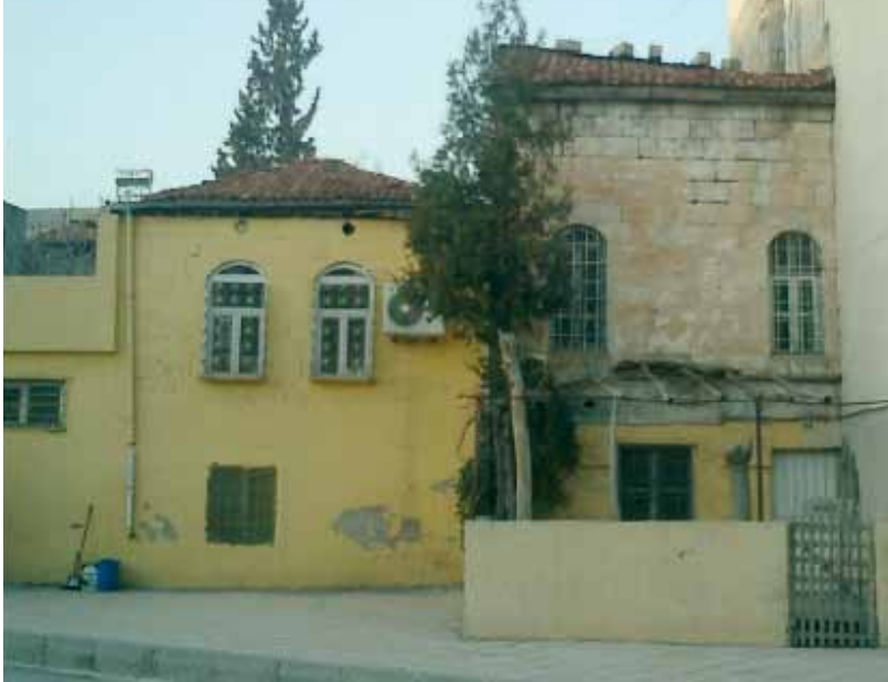
Resim 4: Dere Kenarı Sokağı'na açılan, sağdan sola doğru 144 ve 74 nolu parsellerde yer alan tescilli evlerin güney cephelerinin görünümü (G. Gül, 2010)