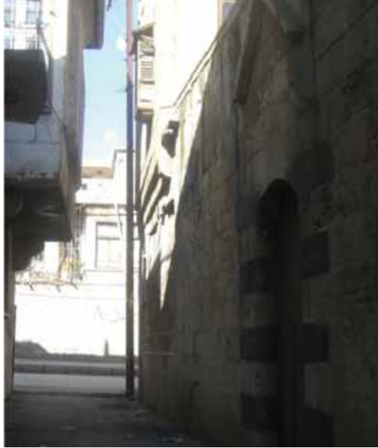
Resim 16: Bay Asım Çıkmaşı'nın doğusundaki, renkli taşlarla iki yandan bezenmiş üçgen alınlıklı avlu (hayat) kapısı