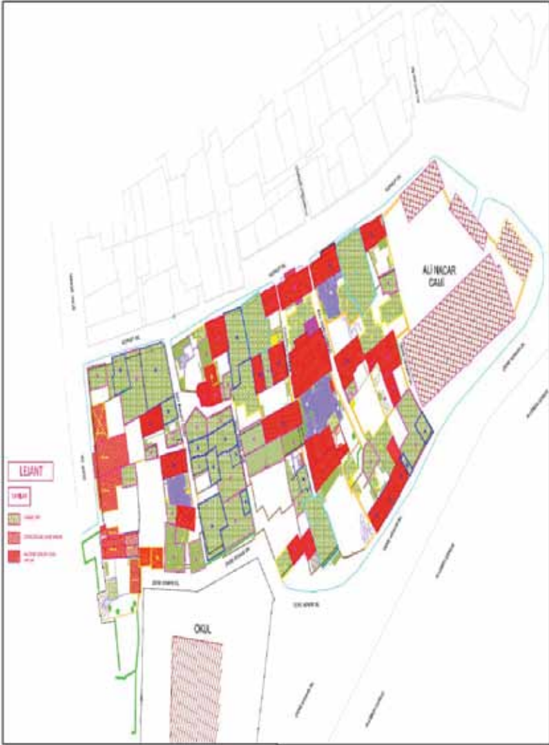
Şekil 1: Yaprak Mahallesi'ndeki sokaklar (Y.Mim. ve Rest.: Gonca Gül-Ayşe Korkmaz; Harita Müh.: Osman Tezel ve Stajyer: İbrahim Yıldırım, Ekim 2010)