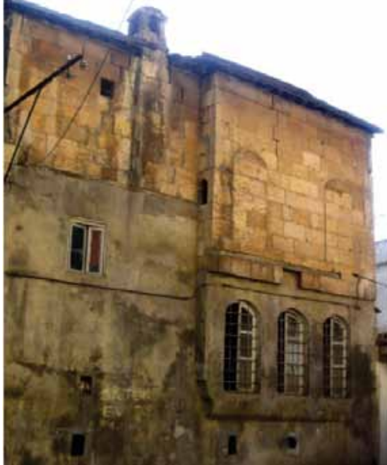
Resim 6: Kepkep Sokağına açılan 152 nolu parseldeki evin kuzey cephesi (G. Gül, 2010)