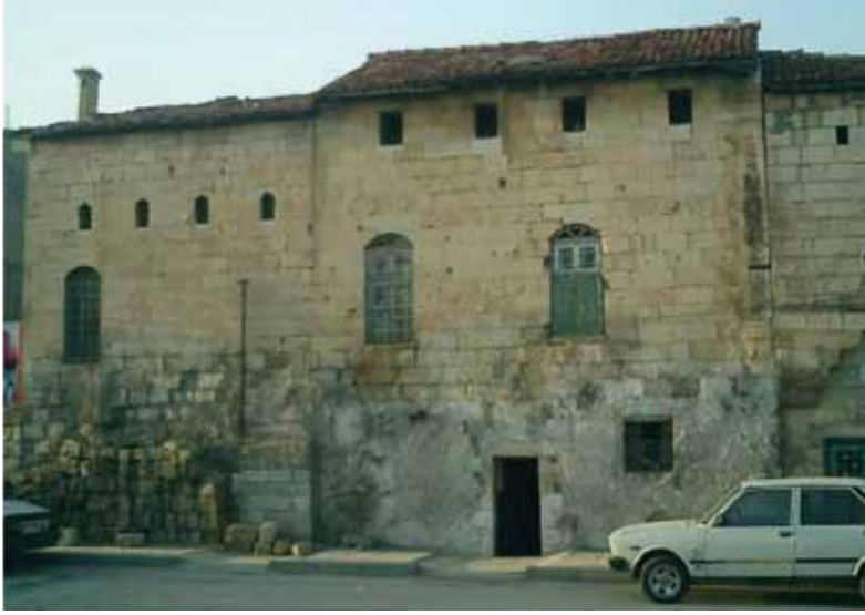
Resim 3: Dere Kenarı Sokağı'na açılan sağdan sola doğru birbirine bitişik 89 ve 88 nolu tescilli evlerin sokak cepheleri (G. Gül, 2010)