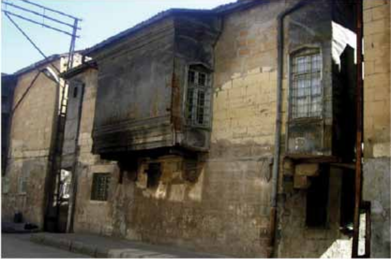
Resim 8: Kepkep Sokağına açılan 85 nolu parseldeki evin kuzey cephesinde yer alan taş konsollu çıkma (G. Gül, 2010)