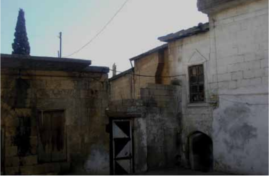
Resim 1: 57 parsel numaralı evin Şose Sokağına açılan avlu (cümle) kapısı (sağda), (G. Gül, 2010)