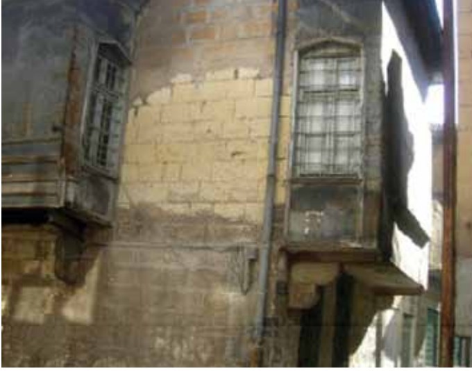
Resim 13: Kuzeyden Kepkep Sokağına, doğudan Canoğlu Çıkması'na açılan 85 nolu parseldeki evin geleneksel özelliklerini koruyabilmiş taş konsollu, çıkmalı cepheleri