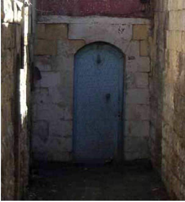
Resim 18: Bay Asım Çıkmazı'nın sonundaki el biçimli kapı tokmağına sahip kapı örneği (G. Gül, 2010)