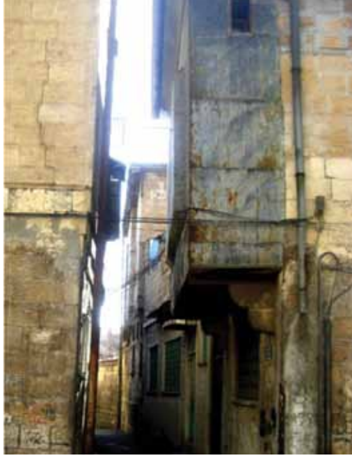
Resim 15: Bay Asım Çıkmaşı'nın Kepkep Sokağına açılışı (G. Gül, 2010)