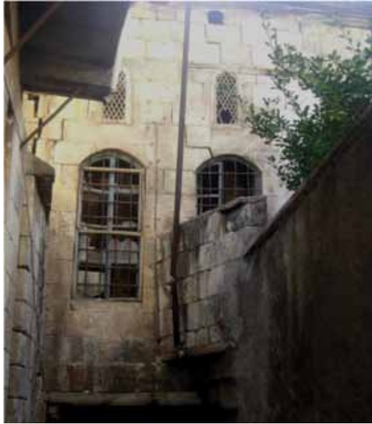
Resim 12: Canoğlu Çıkması'ndaki kabaltının üzerindeki evin cephesinden detay - güneye doğru bakış (G. Gül, 2010)