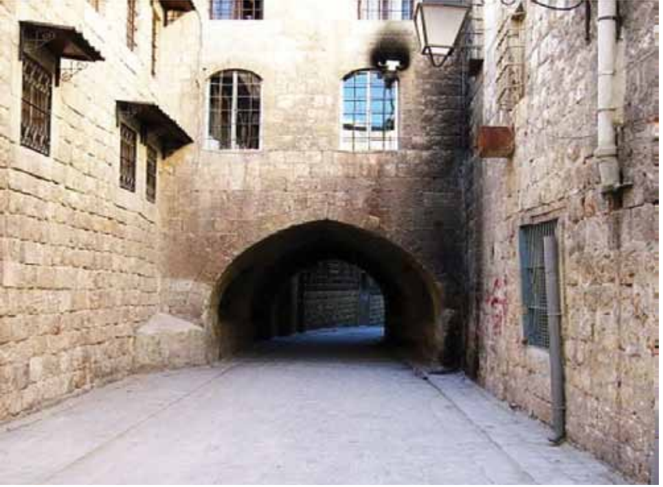
Resim 19: Halep'ten 17. yüzyıla ait bir abbara ( http://en.wikipedia.org/wiki/Armenians_in_Syria )