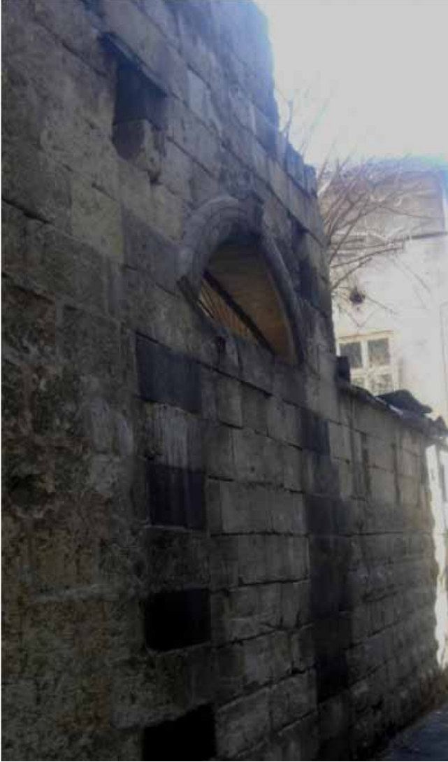
Resim 17: Bay Asım Çıkmaşı'nın doğusundaki renkli taşlarla iki yandan bezenmiş, örülerek daha sonradan kapatılmış yuvarlak kemerli avlu (hayat) kapısı (G. Gül, 2010)