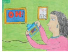
Büşra Işıkcın Oh Çekmek