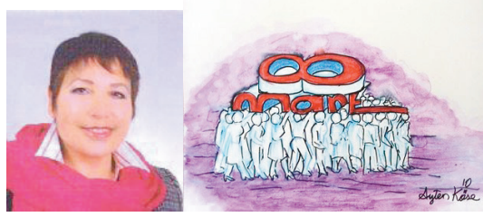
Ayten Köse'den bir karikatür