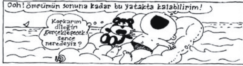
Nuray Çitçi'den Bulut Bebek