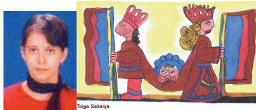
Tolga Sakarya'dan bir karikatür