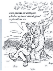
Zeynep Gargi'den bir karikatür