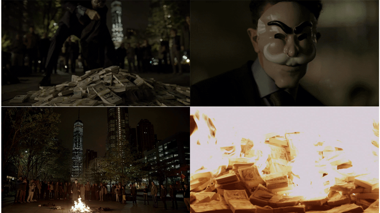
Resim 1-2-3-4. Mr. Robot Dizisinden Sahneler