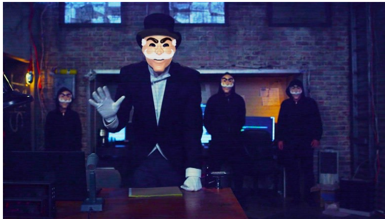
Resim 5. Mr. Robot Dizisinden Sahne