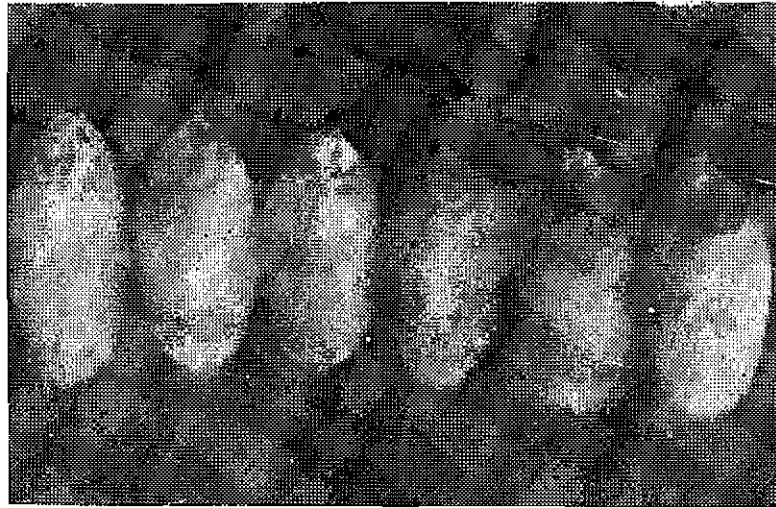
ŞEKİL 1 Sağlam ve embriyo kısımları esmerleşmiş, hastalıklı taneler (Orig. 20.XI.1964 Eskişehir)

1964 senesinde, sulanır şartlarda yapılan buğday ıslahına ait materyal gözden geçirilirken, bazı buğday çeşitleri ve açılması duran melezlerde, tanelerin embriyo kısımlarında meydana gelmiş esmer, koyu lekeler dikkatini çekti. Şekil 1 de görülen bu lekeler, cetvel 1 de isim, tür ve gelcükleri yerleri bildirilen 234, 406, 2800, 4871, 4951, 5006, 5010, 5024 kütük numaralı çeşitlerle, 87, 310 numaralı çeşitlerin ebeveyn olarak kullanıldığı F 8 generasyo- nundaki P20 melezleme projesinde müşahade edildi.