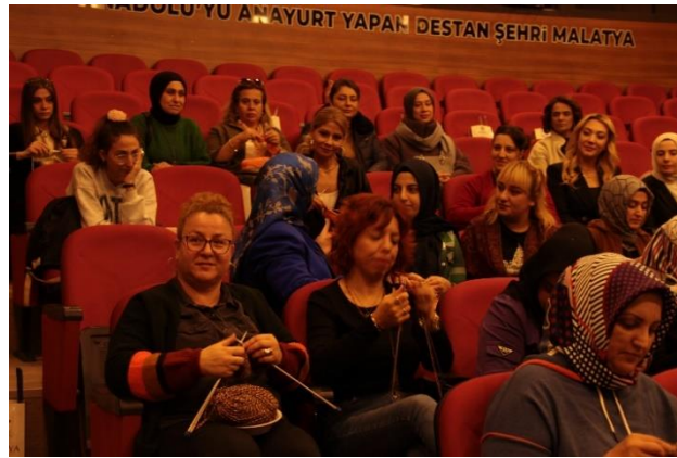
Görsel 4. "Belki Şehre Bir Film Gelir" MABESEM, Malatya, 2024.

Projenin bir diğer mekânı olan MABESEM Binası'nda ise iki etkinlik gerçekleştirilmiştir. "Belki Şehre Bir Film Gelir" isimli bu etkinlik sinema ve örgü örme etkinliğinin bir arada olduğu mekândır. Bu mekânda buluşan kadınlar örgülerini örerlerken film de izlemişlerdir. Mekânın ışığı ona göre ayarlanmıştır (Görsel 4-5).