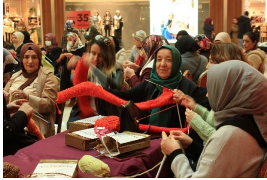
Görsel 3. Etkinlik Esnasından, AVM Alanı, Malatya, 2024.

Projenin bir diğer mekânı olan MABESEM Binası'nda ise iki etkinlik gerçekleştirilmiştir. "Belki Şehre Bir Film Gelir" isimli bu etkinlik sinema ve örgü örme etkinliğinin bir arada olduğu mekândır. Bu mekânda buluşan kadınlar örgülerini örerlerken film de izlemişlerdir. Mekânın ışığı ona göre ayarlanmıştır (Görsel 4-5).