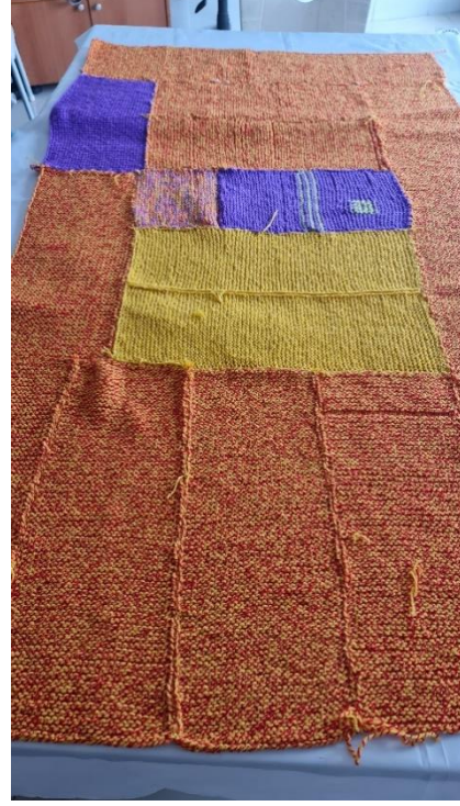
Görsel 11. Örülen Parçaların Birleştirilmesi ile Oluşan Bir Battaniye.

Sergilenen mekânlar da, etkinliğin ruhunu yansıtacak şekilde özenle seçilmiştir. İnönü Üniversitesi Rektörlük binasının önündeki ağaçlık alan, Güzel Sanatlar ve Tasarım Fakültesi gölet çevresi ve AVM önündeki ağaçlık alanlar, battaniyelerin doğal ortamlar içinde sergilenmesine olanak tanımıştır. Bahar aylarında seçilen bu mekânlar, battaniyelerin asılması veya yeşilin üzerine serilmesiyle estetik bir bütünlük oluşturmuştur. Ziyaretçiler, bu mekanlarda battaniyeler üzerindeki detayları keşfederek, her birinin farklı bir anlam taşıdığını deneyimlemiştir. Mevsimsel döngülerin sembolü olarak, geçmişin hafızasını silip yeni başlangıçlara adım atmanın simgesi olarak algılanmıştır.