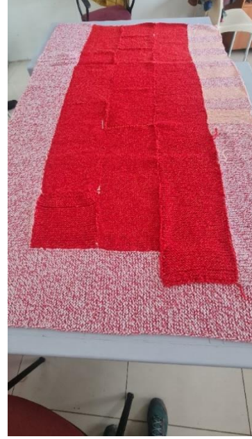
Görsel 7. Örülen Parçaların Birleştirilmesi Aşaması.