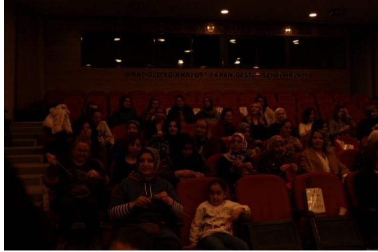
Görsel 5. "Belki Şehre Bir Film Gelir" MABESEM, Malatya, 2024.

Bu etkinlik, bireyleri bir araya getirerek sosyal etkileşimleri teşvik etmiştir. Katılımcılar, birlikte zaman geçirip ortak bir etkinliğe katılmış, sosyal bağlar kurarak, topluluk duygusunu geliştirmişlerdir. Katılımcı sanat, izleyiciyi pasif bir gözlemci olmaktan çıkarıp etkin bir katılımcıya dönüştürmesini sağlar. Örgü örme ve film izleme etkinliği de katılımcıların aktif olarak sürece dahil olmasını ve kendi deneyimlerini yaratmasını sağlamıştır.