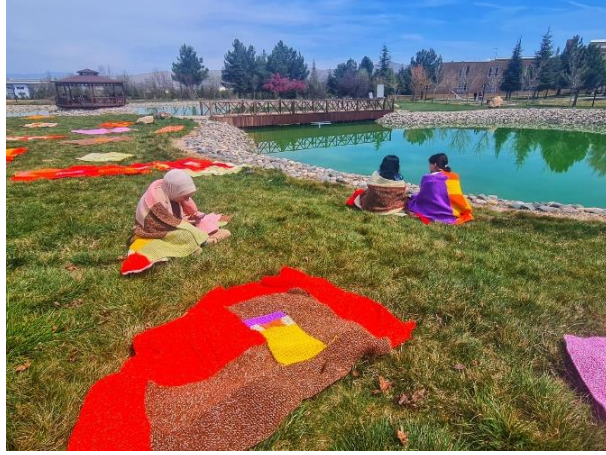
Görsel 13. Sergi Alanından, İnönü Üniversitesi GSTF Gölet Çevresi, Malatya, 2024.

Örgülerle üretilen battaniyelerin dış mekânda sergilenmesi, katılımcı sanat açısından toplumsal etkileşimi, erişilebilirliği ve sanatın gündelik yaşamla bütünleşmesini teşvik eden önemli bir yaklaşımdır. Dış mekân sergileri, sanatın daha geniş kitlelere ulaşmasını sağlar, sosyal karşılaşmaları ve etkileşimleri artırır ve yerel topluluklarda toplumsal bağların ve dayanışmanın güçlenmesine katkıda bulunur. Bu şekilde, sanatın toplumsal ve politik boyutları daha görünür hale gelir ve bireylerin yaşamlarında somut değişiklikler yaratma potansiyeli taşır.