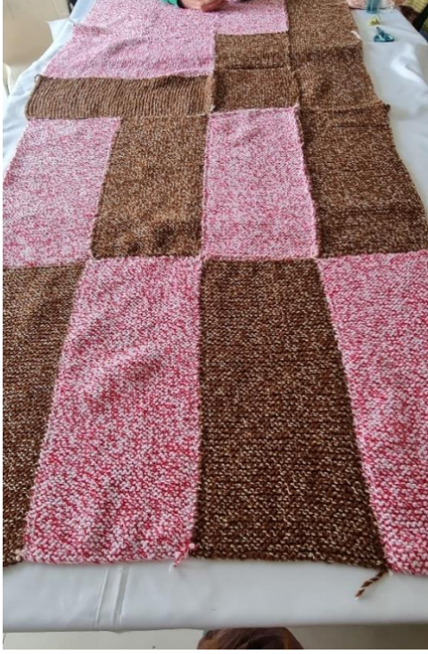
Görsel 10. Örülen Parçaların Birleştirilmesi ile Oluşan Bir Battaniye.