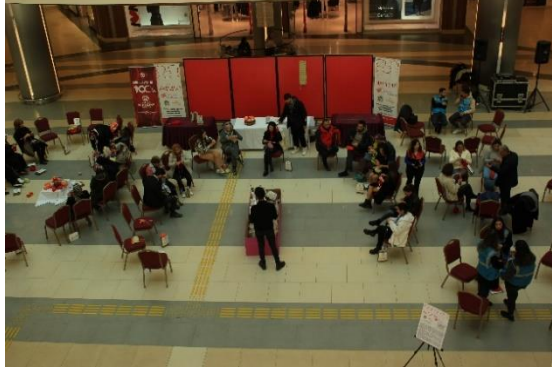
Görsel 2. Etkinlik Esnasından, AVM Alanı, Malatya, 2024.

anlam ve sorumlulukla ilişkilendirilmiştir. Çünkü örmenin önemli bir şey olduğunu düşünen bazı katılımcılar bu potansiyelle birlikte bu durumun önemli bir parçası olacaklarını düşünmüşlerdir. Kimi katılımcılar ise bu hareketli ortamda insanlarla diyalog kurmanın hazzı ile soru ve cevaplarını önemsememişlerdir. Etkinlik esnasında zaman zaman bunun bir katılımcı sanat etkinliği olduğunu ifşa eden "çünkü" ile başlayan açıklamalı cümleler kurulsa da en çok birbirlerinin sorularına verdikleri cevap 'yardım için' şeklinde olmuştur. Bu ve buna benzer cevaplar etkinliğin seyrini değiştirmemiş, sadece bu cevaplar yaşanmışlıklarla desteklenen küçük sohbetler oluşturmuştur.