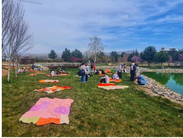
Görsel 14. Sergi Alanından, İnönü Üniversitesi GSTF Gölet Çevresi, Malatya, 2024.

Örgülerle üretilen battaniyelerin dış mekânda sergilenmesi, katılımcı sanat açısından toplumsal etkileşimi, erişilebilirliği ve sanatın gündelik yaşamla bütünleşmesini teşvik eden önemli bir yaklaşımdır. Dış mekân sergileri, sanatın daha geniş kitlelere ulaşmasını sağlar, sosyal karşılaşmaları ve etkileşimleri artırır ve yerel topluluklarda toplumsal bağların ve dayanışmanın güçlenmesine katkıda bulunur. Bu şekilde, sanatın toplumsal ve politik boyutları daha görünür hale gelir ve bireylerin yaşamlarında somut değişiklikler yaratma potansiyeli taşır.