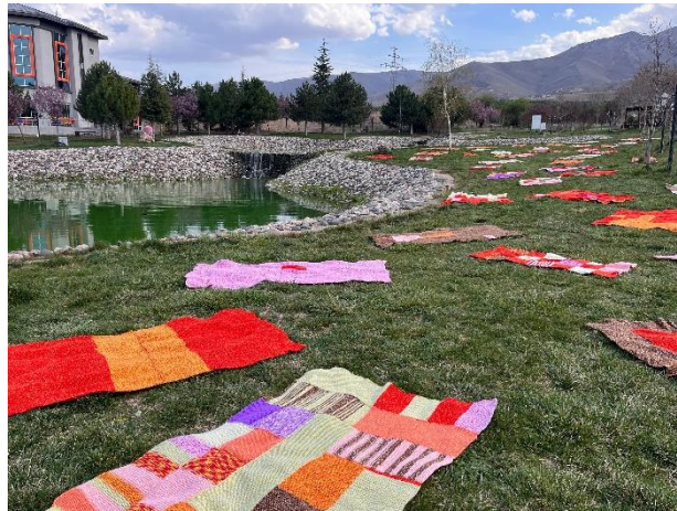
Görsel 12. Sergi Alanından, İnönü Üniversitesi GSTF Gölet Çevresi, Malatya, 2024.

'Nasılın?' örgü buluşması, sanatın ve toplumsal iş birliğinin gücünü bir araya getirerek, 46 benzersiz battaniye ile zenginleşen sergi mekanlarında yeni deneyimler oluşturarak tamamlanmıştır (Görsel 12-13-14-15-16).