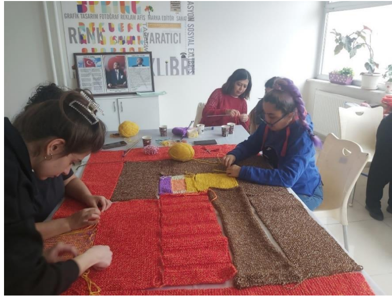
Görsel 9. Örülen Parçaların Birleştirilmesi Aşaması.

Battaniyelerin birleştirilme süreci, 'Nasılın?' örgü buluşmasının önemli bir aşamalarındandır (Görsel 7-9). Farklı ölçü ve renklerde örülen parçaların bir araya getirilmesi, katılımcıların iş birliği ve estetik anlayışlarının öne çıktığı bir süreçtir. Başlangıçta belirlenen 30 ilmek ve maksimum 1 metre uzunluk gibi sınırlamalar, çeşitli sebeplerden dolayı esneklik göstermiş ve bu durum, 46 farklı boyutta ve renkte battaniyenin oluşmasına imkân sağlamıştır (Görsel 8-10-11).