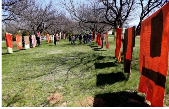
Görsel 16. Sergi Alanından, AVM önündeki ağaçlık alanlar, Malatya, 2024.