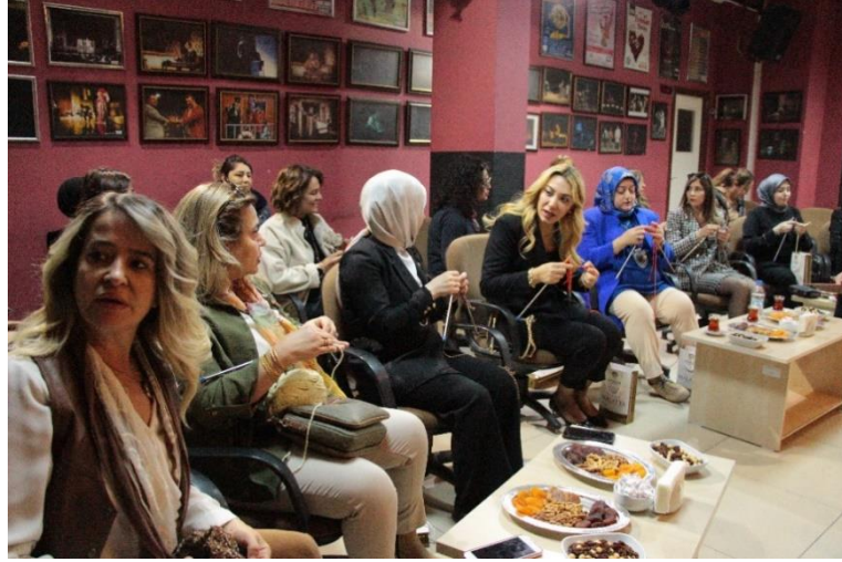
Görsel 6. "Gönül Sohbet İster Kahve Bahane" MABESEM, Malatya, 2024.