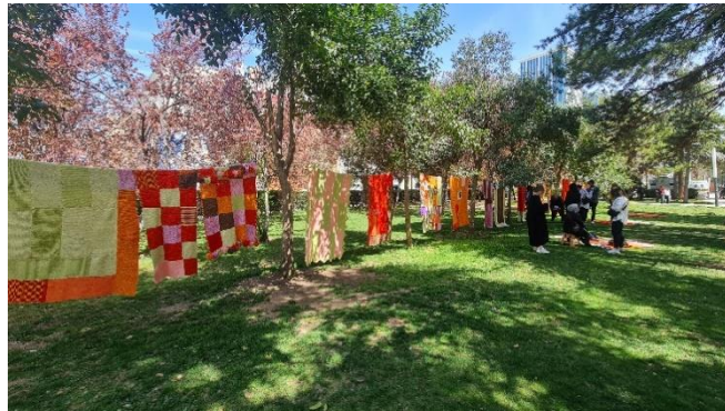
Görsel 15. Sergi Alanından, İnönü Üniversitesi Rektörlük binasının önündeki ağaçlık alan, Malatya, 2024.