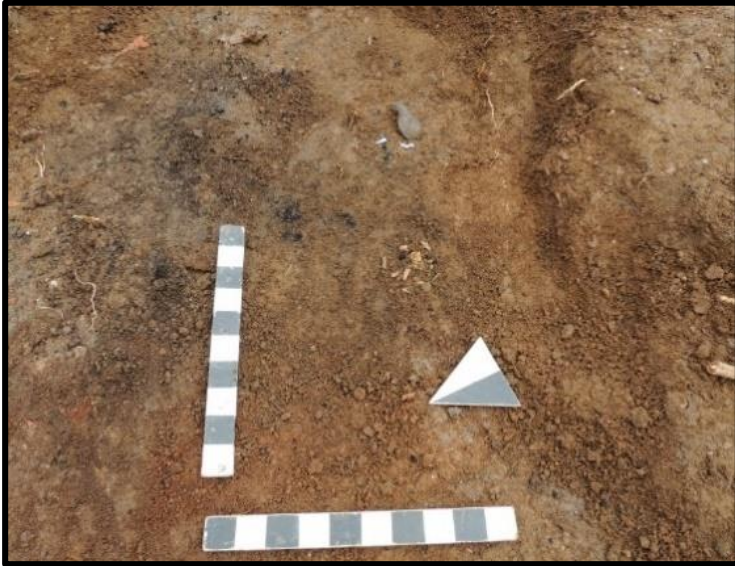
Fig. 15: 4 No.lu Mezar – Kandil