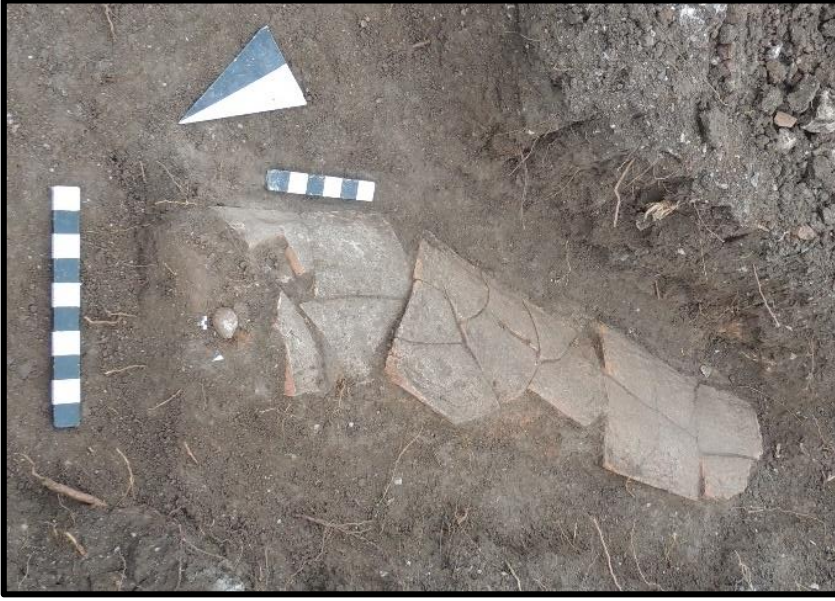
Fig. 3: 1 No.lu Mezar - Kremasyon Kalıntıları