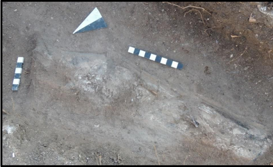
Fig. 4: 1 No.lu Mezar - Unguentarium Gövdesi