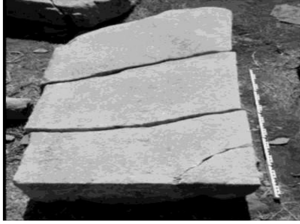
Resim 2: Tapınağın kuzey girişi Kaynak: Lohmann, 2006:29)