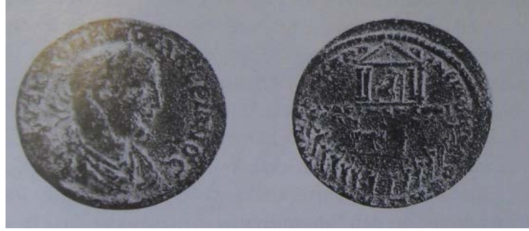
Resim 1: Gallus Trebonianus dönemine ait bir birlik sikkesi

egemenliği döneminde, bu döneme tarihlenen Panionion sikkelerinden izlenebildiği kadarıyla festivaller, Apollon Klarios onuruna düzenlenmiş, tapınım asıl özelliklerini yitirmiştir.