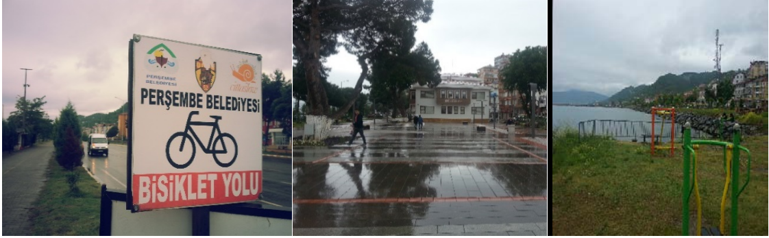
Fotoğraf 6: Bisiklet yolu, kent meydanı ve belediye binası, sahildeki oyun parkı

Bisiklet ve yaya yolları, sahil boyunca uzanan park ve çocuk oyun bahçesi alanları bulunmaktadır. Bununla birlikte devlete ait yapılar, çay bahçeleri, kafeler, otopark ve düğün salonu gibi mekânlar sahil yolu üzerinde yer almaktadır. 2014 yılında hizmete giren ve yerel mimari ile uyumlu belediye hizmet binasının önünde genişçe bir meydan çalışması yapılmıştır. Önceden araçların otopark olarak kullandığı alan dönüşüm geçirmiştir. Kent meydanının aksine yayalaştırma yapılmış sokak bulunmamaktadır, yol ve kaldırım gibi kamusal mekânlar mevcut görünümüyle kalmıştır. Ancak Yıldırım ve Karahmet (2013: 18)'in de belirttiği üzere Kumbaşı ve Kalekaya mahalleri arasında sahil boyunca 10 km bisiklet yolu yapılmıştır.