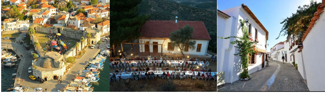
Fotoğraf 1: Sığacık Pazarı, Doğa Okulu, Sığacık Kalesi içinde bir sokak

Ayrıca Seferihisar'ın çeşitli yerlerinde mahalle parkları, Dutlaraltı Meydanı, Çocuk ve Gençlik Meydanı, Okul Tarlaları, Eski Dostlar Kahvesi, Teos Doğa Parkı, Ürkmez Sineması, Cihan Ünal Tiyatrosu, Seferi Sinema, Yaşayan Kale, Can Yücel Tohum Takas Merkezi, Sığacık Meydan Parkı, Gençlik Merkezi, Kent Belleği Anı Evi gibi kamusal mekânlar düzenlenmiştir/inşa edilmiştir (Seferihisar.bel.tr, 2015d; Seferihisar Belediyesi, 2010; 2011; 20