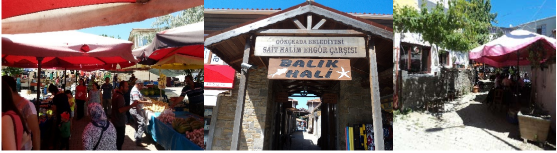
Fotoğraf 3: Gökçeada Pazarı, Balık Hali, araç trafiğine kapalı Menekşe Sokağı

kapalı yayalaştırılmış sokaklar da bulunmaktadır. Kent merkezinde Büyük Kilise ve Fatih Camisi bahçeleriyle, güzel biçimde düzenlenmiş olup kentteki Belediye ve Kaymakamlık gibi devlet yapılarında da çevre düzenlemeleri görülmektedir. Sakin Kent üyeliği sonrası dönüşüme uğrayan kamusal mekânlar; düzenlenmiş olan Balık Halinin de yer aldığı Sait Halim Ergör Çarşısı ve 2015 yılında açılan Üretici Pazarıdır. İlçe merkezinde tahsis edilen alan pazar için düzenlenerek yerel üreticilere tahsis edilmiştir. Gökçeada'nın Üretici Pazarı, Yavaş Yemek hareketindeki Yeryüzü Pazarları 9 (Earth Markets) uygulaması kapsamında bu unvana sahip Foça Pazarı ile birlikte Türkiye'deki iki pazardan biridir. Kendine göre çeşitli kriterler taşıyan Yeryüzü Pazarı için mekânsal düzenleme de yapılmıştır. Pazar günleri kurulan Gökçeada'nın kent pazarı içinse Nadir Nadi Caddesi araç trafiğine kapatılmaktadır. Gökçeada ilçe merkezinde Sakin Kent görünürlüğünün sağlandığı göze çarpılmaktadır.