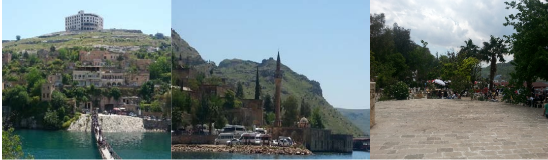
Fotoğraf 9: Eski Halfeti ve otel inşaatı, Tarihi Ulu Cami'nin çevresi, çay bahçesi

Eski Halfeti'de önemli tarihi yapılar ve özgün bir kentsel mimari doku bulunmaktadır. Kimi eski evler konaklama, yeme-içme gibi turizme dönük hizmetlerde kullanılmaktadır. Ancak Halfeti'de yeni inşa edilmekte olan beş yıldızlı bir otel binası, mimari görüntünün dışında bir özellikte olup kentsel dokuyu bozmaktadır. Gülbandır (2015: 37) yerel halkın bu durumun farkında olmasına rağmen turizmden gelir getireceği ve ziyaretçilerin konaklama yapmasını sağlayacağı düşüncesiyle karşı çıkmadığını belirtmiştir.