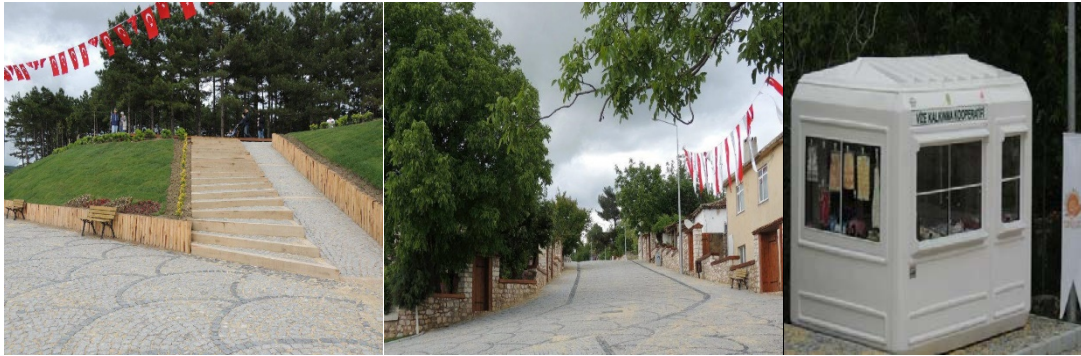
Fotoğraf 7: Kale çevre düzenlemesi, sokak sağıklaştırması, kooperatif satış yeri

Sakin Kent üyeliği öncesi Vize kentinde ön plana çıkan kamusal mekânlar; belediye çocuk parkı ve çay bahçesi, Vize Halk Kütüphanesi, belediye tarafından inşa edilen Atatürk Açık Spor Tesisi, yeme-içme yerleri, engellilere uygun kaldırımlar, belediye internet evi gibi mekânlardan meydana gelmektedir. Sakin Kent üyeliği sürecinde Kale Mahallesi'nde yürütülen çalışmalar önemlidir. Vize'nin eski kent kısmı olan Mimar Sinan Mahallesi'nde, sokak sağıklaştırma çalışmaları hayata geçirilmiştir. Bu kapsamda evlerin duvar ve cepheleri de düzenlenmiş ve muhitte yer alan Vize Ayasofyası/Gazi Süleyman Paşa Camii, Hasan Bey Camii, Vize Kalesi gibi tarihi yapıların çevre düzenlemeleri yapılmıştır. Eski kent kısmının bütünsel biçimde yenilenmesi Sakin Kent kapsamındaki en önemli dönüşüm projesi olmuştur. Ayrıca Sakin Kent üyeliği ile birlikte Vize Kent Ormanı kurularak burada çeşitli sosyal etkinlik mekânları oluşturulmuştur. Bir diğer çalışma 2013 yılında belediye tarafından yapımına başlanan otel ve çok amaçlı kültür merkezi olmuştur (Vize Belediyesi, 2014: 7-8).