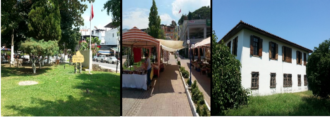
Fotoğraf 5: Turgut Özal Parkı, Doğal Ürünler Pazarı, Yörük Ali Efe Evi Müzesi

Yenipazar'ın en önemli değeri olan Yörük Ali Efe'nin doğup büyüdüğü ev günümüzde Kültür ve Turizm Bakanlığı'nca Yörük Ali Efe Müzesi olarak halka açılmıştır. Kentin gözlemlenen kamusal mekânları arasında yer alan Belediye Meydanı genişçe bir alanı kaplamakta ve etkinlikler için yayalaştırılmış durumdadır. Kentin tepelere doğru olan kısımlarında piknik alanları ve seyir terası gibi mesirelik yerler mevcutsa da belli bölümü özel işletmelere devredilmiş durumdadır. Çamlık mesire yerinde yer alan eski değirmen ise kentin ayakta kalan tarihi yapılarından biridir.