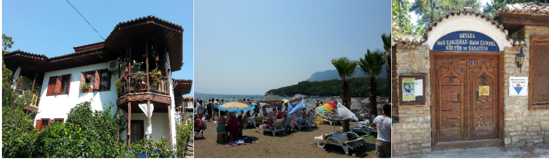
Fotoğraf 2: Geleneksel mimaride bir ev, Akyaka Halk Plajı, Nail Çakırhan Evi

Akyaka Belediyesi, civar köylerdeki üreticilere pazar yerinden ücretsiz yer tahsis ederek ürünlerini satabilmesine imkân sağlamıştır (Bekar vd. 2015: 61). Ayrıca yerel yönetimin çalışmalarıyla düzenlenen Akyaka'nın Mavi Bayraklı Halk Plajı bulunmaktadır ancak yaz döneminde ücretlidir. Plaja çıkan yollar araç trafiğine kapalı durumdadır. Kent merkezinde denize dökülen Azmak Deresi kenarında trafiğe kapalı bir yürüyüş yolu vardır. Kent merkezinde büyük otoparklar mevcuttur, bu durum yaz aylarındaki yoğun turist akımının bir sonucudur. Kent merkezinde trafiğe kapalı caddenin bulunması da birtakım düzenlemelerin yapıldığına işaret eder. Ayrıca Sakin Kentin tanıtım işaretleri nispeten kısıtlıdır.