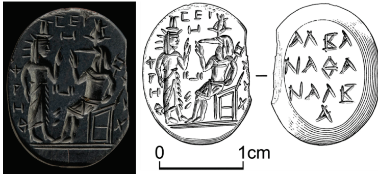
Figür 3: Tanrı Thoth ve İsis, Kazıma Tekniği ve Pahlanmış Kenarlar, Hematit Taşından Yapılmış Amulet, Doğu Akdeniz, Geç Roma Dönemi.