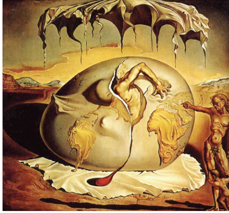
Figür 1: Yeni Bir Adamın Doğuşunu Seyreden Jeopolitik Çocuk, Tuval Üzerine Yağlı Boya, 45,5 x 50 cm., Salvador Dali, 1943.