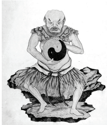
Figür 6: İlksel Varlık Pan-gu'nun Evreni Oluşturan İki Özü Yin (Gölgeli) ve Yan (Güneşli)'i Yaratması.