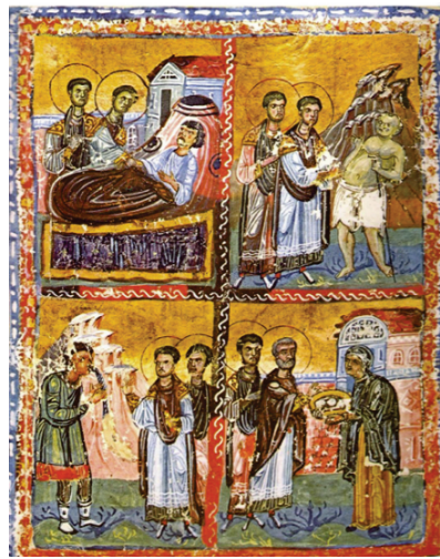
Figür 19: Aziz Kosmas ve Damianos'un Mucizeleri- Palladia'nın İyileştirilmesi, El Yazması, Panteleimon MS 2, 197a, Aynoroz Dağı, XI Yüzyıl.