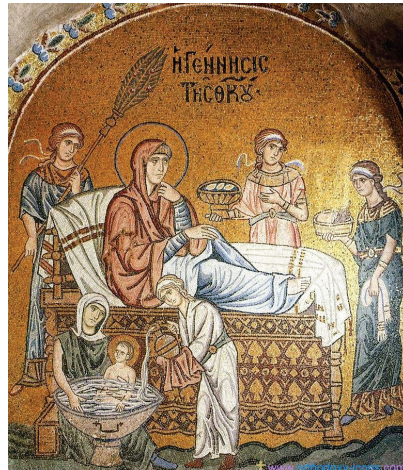
Figür 23: Anna'nın Meryem'i Doğurması Sahnesi, Duvar Resmi-Mozaiik, Daphi Manastır Kilisesi-Daphne Monastery Church, Yunanistan, XI. Yüzyılın İkinci Yarısı.