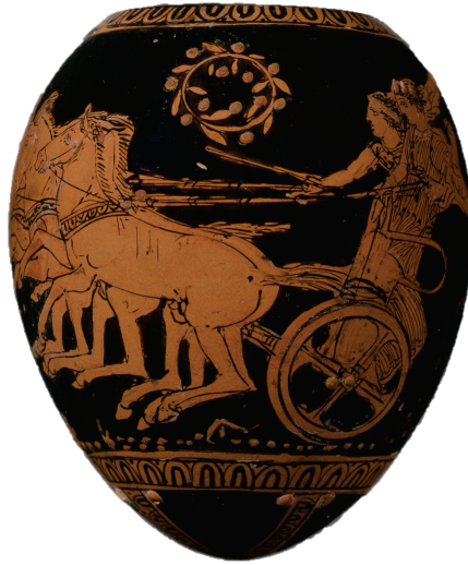
Figür 14: Truvalı Helen Olarak Tanımlanan Bir Kadının Kaçırılması Sahnesi, Pişmiş Toprak Vazo (Yumurta Biçimli Cenaze Vazosu), Atina MÖ 410.