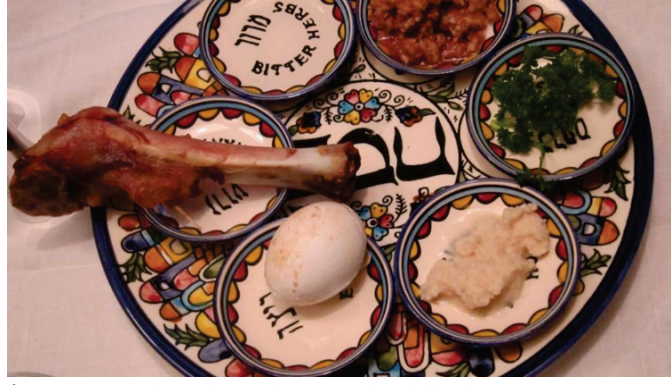
Figür 15: Fısıh Seder Tabağı (Yahudilerde Cenaze Yemeği).