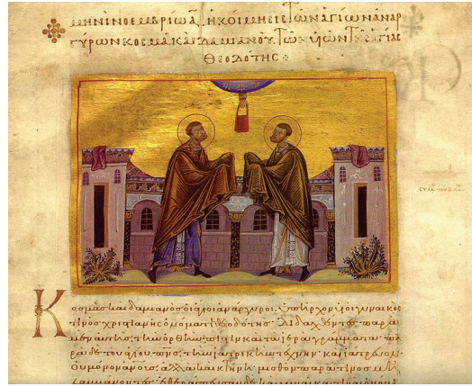
Figür 18: Aziz Kosmas ve Damianos, El Yazması, Vatikan Apostolica Menologion (II. Basil) Kütüphanesi, Vat.gr.1613, fol. 152, 978-1026.