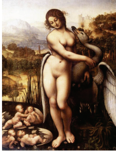
Figür 10: Leda ve Kuğu, Cesare da Sesto, Tuval Üzerine Yağlı Yağlı Boya, 96.5x73.7 cm, Wilton House, İngiltere, 1515.