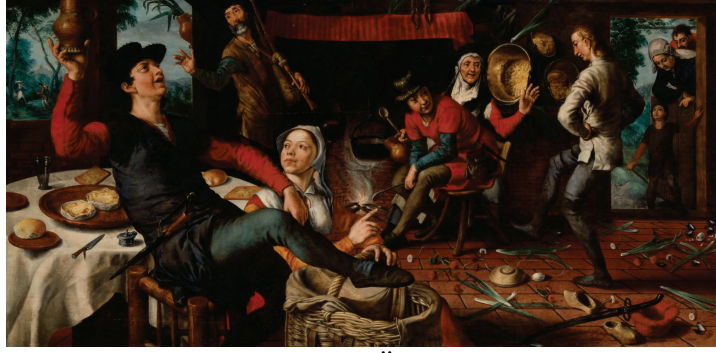
Figür 12: Yumurta Dansı, Pieter Aertsen, Tuvall Üzerine Yağlı Yağlı Boya, 84cm×172cm., 1552.