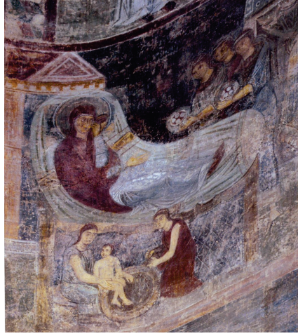
Figür 24: Anna'nın Meryem'i Doğurması Ayasofya Kilisesi, Duvar Resmi-Mozaik, Ayasofya Kilisesi Kiev, Ukrayna, XI. Yüzyılın Ortaları.