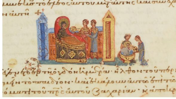
Figür 21: Elizabeth'in Vaftizci Yahya'yı Doğurması Sahnesi, El Yazması, Paris Ulusal Kütüphanesi (Bibliothèque Nationale, Paris), BnF, Tetraevangelio, gr. 74, fol. 106v, XI. Yüzyılın İkinci Yarısı.