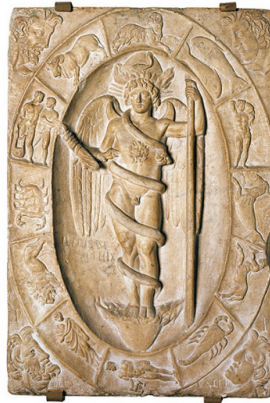
Figür 9: Kozmik Yumurtadan Çıkan Tanrı Phanis, Kabartma Tekniğiyle Yapılmış Rölyef, Modena-İtalya, II. Yüzyıl.