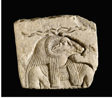
Figür 4: Ağzından Çıkardığı Yumurta ile Tanrı Ptah'ın Oluşumuna Kaynak Olan Kneph'in (Koç Başlı Mısır Tanrısı) Büstü, Kireç Taşı Üzerine Kabartma Tekniğiyle Yapılmış Betim, Mısır, Geç Roma Dönemi.