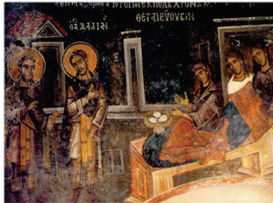
Figür 20: Aziz Kosmas ve Damianos'un Mucizeleri- Palladia'nın İyileştirilmesi, Duvar Resmi-Fresk, Hagios Demetrios Kilisesi (Güney Nef), Mistra- Yunanistan, 1272-1282.