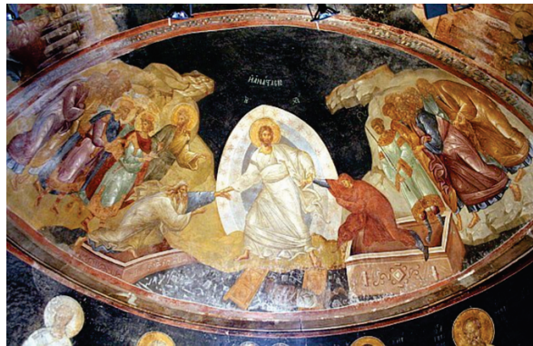
Figür 17: Anastasis-Diriliş Sahnesi, (İsa'nın Arkasında Beliren Mandorlasının Yumurta ile Eşleştirilmesi), Fresk-Duvar Resmi, Khora Manastır Kilisesi, İstanbul, XIII-XIV. Yüzyıl.