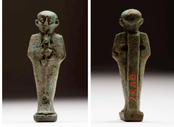
Figür 5: Ustalığın ve zanaatın Tanrısı Ptah, Seramikten Yapılmış Amulet, Memphis, Mısır, MÖ 664-343.