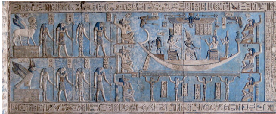
Figür 2: Yaratıcı Tanrılar Grubu Ogdoad'lar, Yüksek Kabartma Tekniği, Hathor Tapınağı, Dendera-Mısır, MÖ I. Yüzyıl (Resimde sağ üstte: Nu ve Nut; sol üst: Hehu ve Hehut; sağ altta: Kek ve Keket; sol altta: "Ni ve Nit").