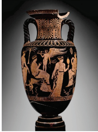
Figür 8: Hippodameia Düğününe Hazırlanıyor (Eurynome, Pothus, Hippodamia, Eros, Iaso ve Asteria), İki Kulplu Amfora, Attika Yunanistan, Klasik Dönem-MÖ 425.