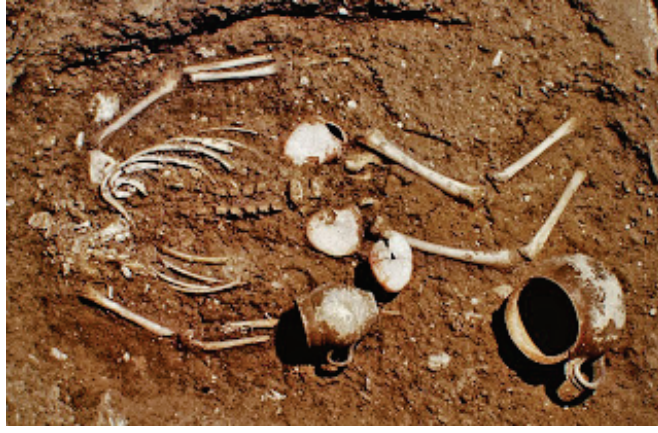
Figür 13: Bir Çocuk Mezarına Adak Objesi Olarak Bırakılan Devekuşu Yumurtası, Vatikan Nekropol Alanı, MS I. Yüzyıl.