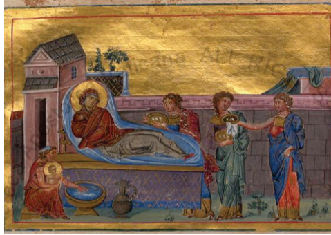
Figür 22: Anna'nın Meryem'i Doğurması Sahnesi, El Yazması, Vatikan Apostolica Menologion (II. Basil) Kütüphanesi, Vat.gr.1613, fol. 22r, 978-1026.