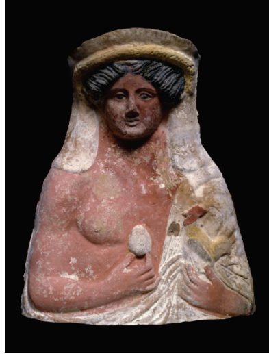
Figür 11: Ruhun ve Yeniden Doğuşun Sembolü Olan Yumurta Tutan Tanrı Dionysos, Pişmiş Topraktan Yapılmış Figürin, Boetian-Tanagra, Yunanistan, MÖ 350.