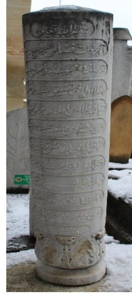
Hasan Fehmi Efendi'ye Ait Mezarın Ayak Şahidesi Dış Yüzü

Kastamonu Şeyh Şaban-ı Velî cami haziresinde 64 adet mezar bulunmaktadır. Bunların 16 tanesi sadece baş şahidesine sahip iken, 48 tanesinin ise hem baş ve hem de ayak şahidesi bulunmaktadır. Türbenin içinde ise 16 adet sandukalı mezar bulunmaktadır.