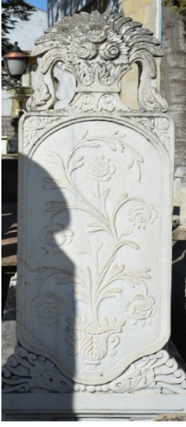
Fatma Hanım'a Ait Mezarın Ayak Şahidesi Dış Yüzü