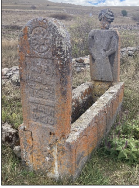
Resim 1: Akçil Köyü Karapapak kıyafetli mezar