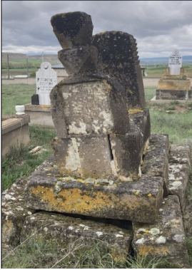
Resim 18: Çakılıkaya Köyü erkek mezarı

Türklerinin yerleşmesine izin vermiştir. Bu yerleşimlerden Pınarbaşı ilçesine bağlı Çakılıkaya Köyü, Karapapak Türklerinin yerleştiği onlarca köyden sadece biri olup çok sayıda mezar taşına ev sahipliği yapmaktadır. Bu taşlardan kitabesi bulunmayan resim 18-19'da gösterilen Karapapak mezar taşı, Kars ve Ardahan'daki örneklerle benzer şekilde yapılmıştır. Kesme taşlardan oluşturulan iki katmanlı subasman üzerine dikdörtgen çerçeveli gövde taşları ve bu gövde taşlarına geçirilen baş ve ayakucu taşından meydana gelen erkek mezarı, biçimlenişi itibariyle tipik bir Karapapak mezarıdır. Başucu taşının baş kısmı papak şeklinde ifade edilmiş olup boyun ve gövde kısmıyla, diğer Karapapak mezar taşlarına paralel bir yapım şekli göstermektedir. Mezarda herhangi bir süsleme unsuru bulunmamaktadır. İşçilik olarak da Kars ve Ardahan'daki örnekler kadar gelişmiş bir uygulama bulunmamaktadır. Ancak papak şeklindeki başlık ve soyut insan heykeli formlu biçimleniş, mezar taşı yapma geleneğinin Kayseri iline kadar taşındığını göstermektedir.