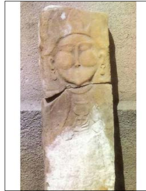
Resim 9: Orta Asya Kadın Taş Heykeli (H.Buğrul'dan)