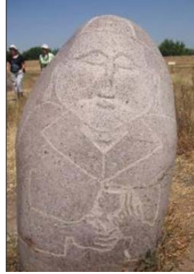
Resim 7: Kırgızistan'dan Taş Baba örneği