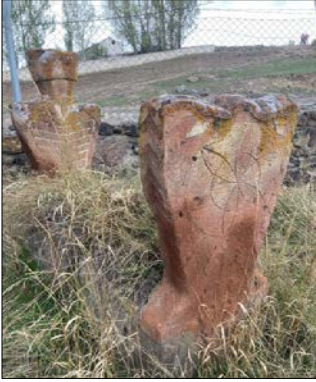
Resim 16: Koçköy erkek mezarı