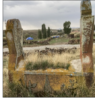
Resim 11: Aslanoğlu Köyü erkek mezarı