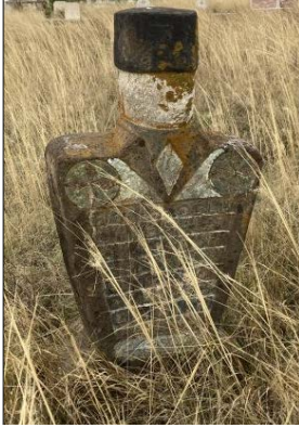
Resim 6: Üçpınar Köyü erkek mezarı

oluşan bu kadın mezarı, insan biçiminde yapılmıştır. Baş, omuz, kollar, eller ve bel kısmının betimlemesi yanında baş kısmında, günümüz itibariyle silinmeye başlayan göz, burun ve ağız öğelerinin tasviri de göze çarpmaktadır. Kadın mezarı olmasından dolayı, başucu taşının başlık kısmı papak formunda işlenmediği görülmektedir. Başucu taşının ön yüzeyinde boyuna asılmış halk arasında beşi bir yerde olarak geçen altınlı kolye, arka yüzeyinde askılı giysi tasviri; ayakucu taşında ise servi ağacı işlemesi yapılmıştır. Üçpınar Köyü'nde bulunan Karapapak kadın mezar taşındaki süsleme detayları, resim 9'da sunulan örnekte görüldüğü gibi, Orta Asya taş heykeliindeki tasvirlerle benzerlik göstermektedir. (Ögel, 2003, s.135). Orta Asya taş heykelleri gibi, Karapapak mezar taşları da genelde yakın bölgede bulunan taş yataklarından çıkarılan taşlarla yapılmış ya da uygun taş bulunmaması durumunda uzaktaki taş yataklarından işlenerek getirilmiştir.