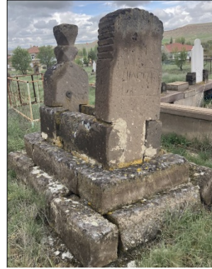
Resim 19: Çakılıkaya Köyü erkek mezarı