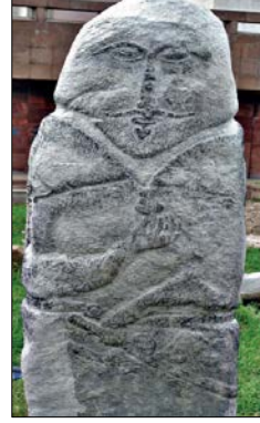
Resim 5: Bir Türk Komutanının Taş Heykeli (G.Kubarev'den)

İslamiyet öncesi Orta Asya Türkleri, ölen kişinin sağlığında göstermiş olduğu fedakârlıkların karşılığı, tarihi hafızanın canlı tutulması ve beraberlik ruhunun sağlanması için ölen kişinin heykeli şeklinde mezar taşları yapmıştır. Ardahan'ın Çıldır ilçesine bağlı Akçakale Köyü mezarlığında bulunan resim 3 ve 4'te görselleriyle birlikte ele alınan Karapapak mezar taşı da aynı amaçlar için yapılmıştır. Köy sakinlerinden edinilen bilgiye göre Şenlik adındaki merhumun 1911 yılında köy arazilerini, başka köy halkından koruması sırasında silahla vurulup öldürülmesinden dolayı, soyut insan heykeli formunda yapılan bu mezar, ölen kişinin yiğitliğine vurgu yapmak amacıyla silah ve kama işlemeli olarak yapılmıştır. Resim 7'de görüldüğü üzere Orta Asya mezar taşlarında da yiğitliğe ve cesarete vurgu yapmak amacıyla benzer betimlemeler bulunmaktadır. Urta