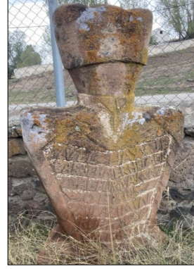
Resim 17: Koçköy erkek mezarı başucu taşı

Orta Asya taş heykellerinin ikonografik özelliklerinin zamana ve bölgeye göre farklılaştığı gibi, Kars'ın Arpaçay ilçesine bağlı Koçköy Mezarlığı'nda bulunan Karapapak mezarı da zamana göre farklılaşmış olup betimlemede geleneksel kıyafetlerin yerini, modern kıyafetlerin aldığı görülür. Ancak kıyafet betimlemesi değişmesine rağmen, araştırma yapılan sahalardaki değişmeyen tek özellik, papak formundaki başlık kısmıdır. Bu, Karapapak Türklerinin kendisini tanımlama şeklidir. Papak formundaki baş kısmından aşağıya doğru yuvarlak boyun, geniş omuzlar, dar bel-karın bölgesi görülmektedir. Başucu taşının ön yüzeyinde, kitabe kısmının hemen üzerinde ceket yakası, gömlek düğmeleri ve kravat bezemesi kabartma yöntemle işlenmiştir. Ayakucu taşının iç yüzünde servi ağacı, dış yüzeyinde ise servi ağacıyla bütünleşen daire içinde çiçek motifi bulunmaktadır. Baş ve ayakucu taşlarının yan yüzeylerinde ise ters V şeklinde bezemeler yapılmıştır. Görüldüğü üzere, modern Türkiye Cumhuriyeti'yle birlikte kullanılmaya başlanan modern giysiler, Karapapak taş mezarlarında da tasvir edilmiş; ancak Karapapak milletinden olduğuna vurgu yapan papak formundaki başlık değişmemiş, devam ettirilmiştir. Taşın heykelsi özelliği, Orta Asya taş babaları karakterine yakın olup betimleme dönemin koşullarından dolayı değişime uğramıştır (Resim 16-17).