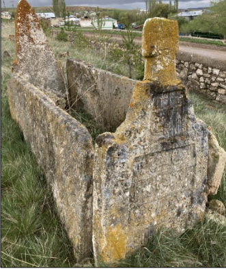
Resim 20: Acıyurt Köyü erkek mezarı

(1.49m.) taşlarından meydana gelmiştir. Başucu taşının başlık kısmı papak formunda şekillenmiş ve kitabe dış yüzeye konumlandırılmıştır. Ayakucu taşı ise aşağıdan yukarıya doğru daralarak üçgen formda sonlanmaktadır. Ayakucu taşının dış yüzeyinde işçiliği iyi olmayan kemer ve fişeklik motifleri bulunmakla birlikte bu motiflerin Kars, Ardahan Karapapak mezarlarında da birçok örneği karşımıza çıkmaktadır.