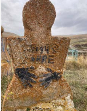
Resim 14: Kardeştepe Köyü Karapapak kadın mezarı

Orta Asya kadın taş heykelleri belden aşağı çeşitli takı ve çiçek tasvirleriyle görülmektedir (Belli, 2002, s.912). Kars'ın Arpaçay ilçesine bağlı Bardaklı Köyü mezarlığında bulunan Karapapak kadın mezarı da (Resim 12) Orta Asya taş ninelerine benzer biçimde, baş kısmında taç ve boyun kısmında kolye ile vurgulanmıştır. Kolyenin iki yanına, gövdenin genişleyen taraflarına gül motifleri işlenmiştir. Kitabenin altında kemer motifi, tüm başucu taşını dolanmaktadır. Başucu taşının arka yüzeyinde kolye motifi yukarıdan aşağıya doğru üç parça halinde kemere kadar işlenmiş ve kemerin altına ise birbirine sırtını dayamış iki ayçiçeği kabartma olarak betimlenmiştir. Başucu taşının dış yüzeyinde ise yine taç motifi, aşağı doğru sarkan kolye motifleri, bel kısmında kemer ve en alt gövde hizasında ayçiçeği motifleri bulunmaktadır. Ayakucu taşının iç yüzeyinde sonu ay-yıldız ile biten ağaç motifi, dış yüzeyinde dalları sıra sıra yanlara sarkan ağaç motifi boydan boya kabartma olarak işlenmiştir. Dikdörtgen çerçevenin iki yan yüzeyinde ise seccade, servi ağacı, cami motifleri kabartma olarak yapılmıştır.