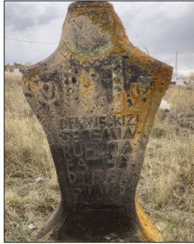
Resim 12: Bardaklı Köyü Karapapak kadın mezarı