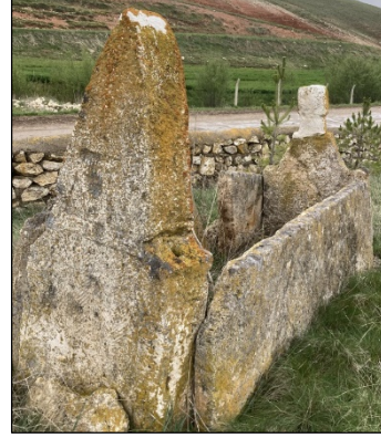
Resim 21: Acıyurt Köyü erkek mezarı