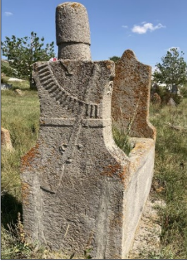
Resim 3-4: Akçakale Köyü Karapapak erkek mezarı