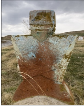
Resim 10: Aslanoğlu Köyü erkek mezarı