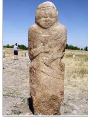
Resim 2: Tokmak-Burana Taş Heykey (İ. Mutlu'dan)