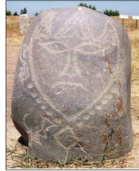
Resim 13: Tokmak-Burana Umay Ana Taş Heykeli (İ.Mutlu'dan)