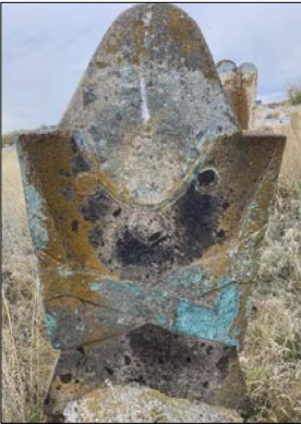
Resim 8: Üçpınar Köyü kadın mezarı