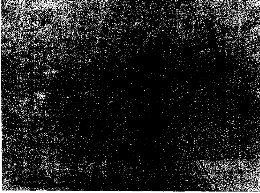
Şekil 1. Ayçiçeği Mildiyösü (P. halstedii) Sporangiofor ve sporangiumları (X400).

talık çıkışı zamanla ters orantılı olarak azalmıştır. 200 sporangium/ml konsantrasyonda 60 dakika sonra ekilen dördüncü tekerrürde hastalık çıkışı hiç olmamıştır. 50.000 sporangium/ml konsantrasyonda hastalık yine çıkmış fakat yüzdesi azalmıştır.