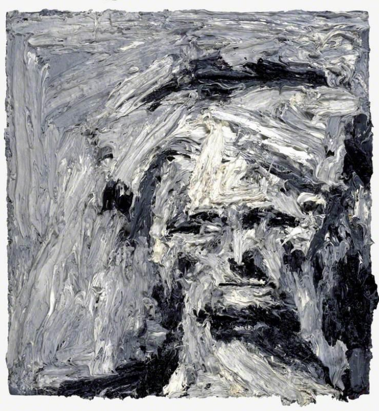
Şekil 3. Frank Auerbach, E.O.W.'nin Başı IV, 1961, Kontrplak Üzerine Yağlıboya, 59,8x56,8 cm.