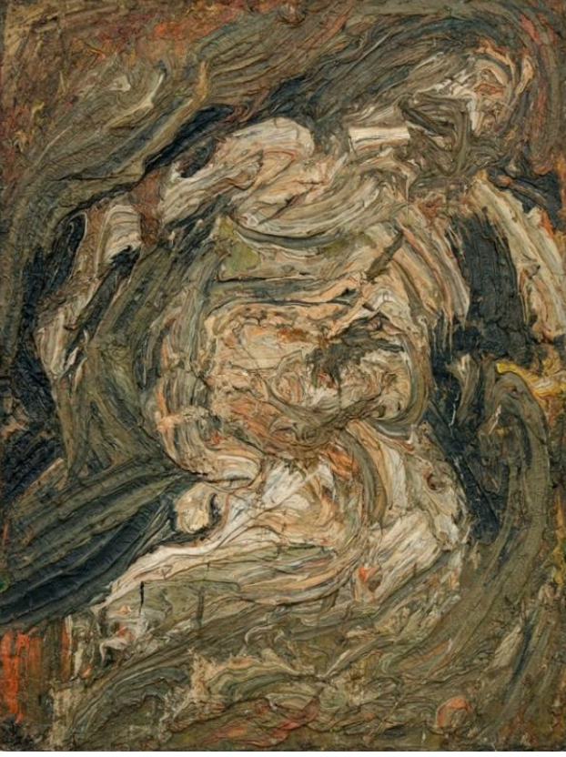
Şekil 7. Leon Kossoff, Oturmuş Nü No 1, 1968, Ahşap Üzerine Yağlıboya, 163x122.5 cm.