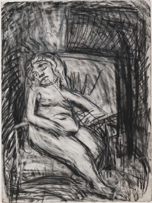
Şekil 8. Leon Kossoff, Sally, 1986, Kâğıt Üzerine Füzen ve Tebeşir, 76.5x56.8 cm.