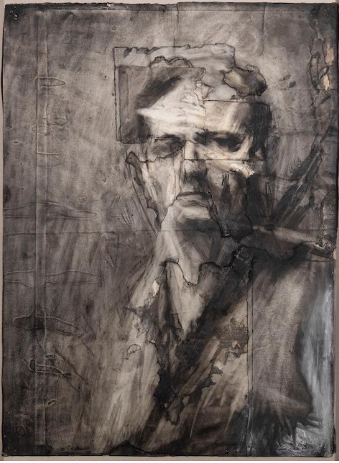
Şekil 4. Frank Auerbach, Otoportre, 1958, Kâğıt Üzerine Füzen ve Tebeşir, 76.8x56.5 cm.