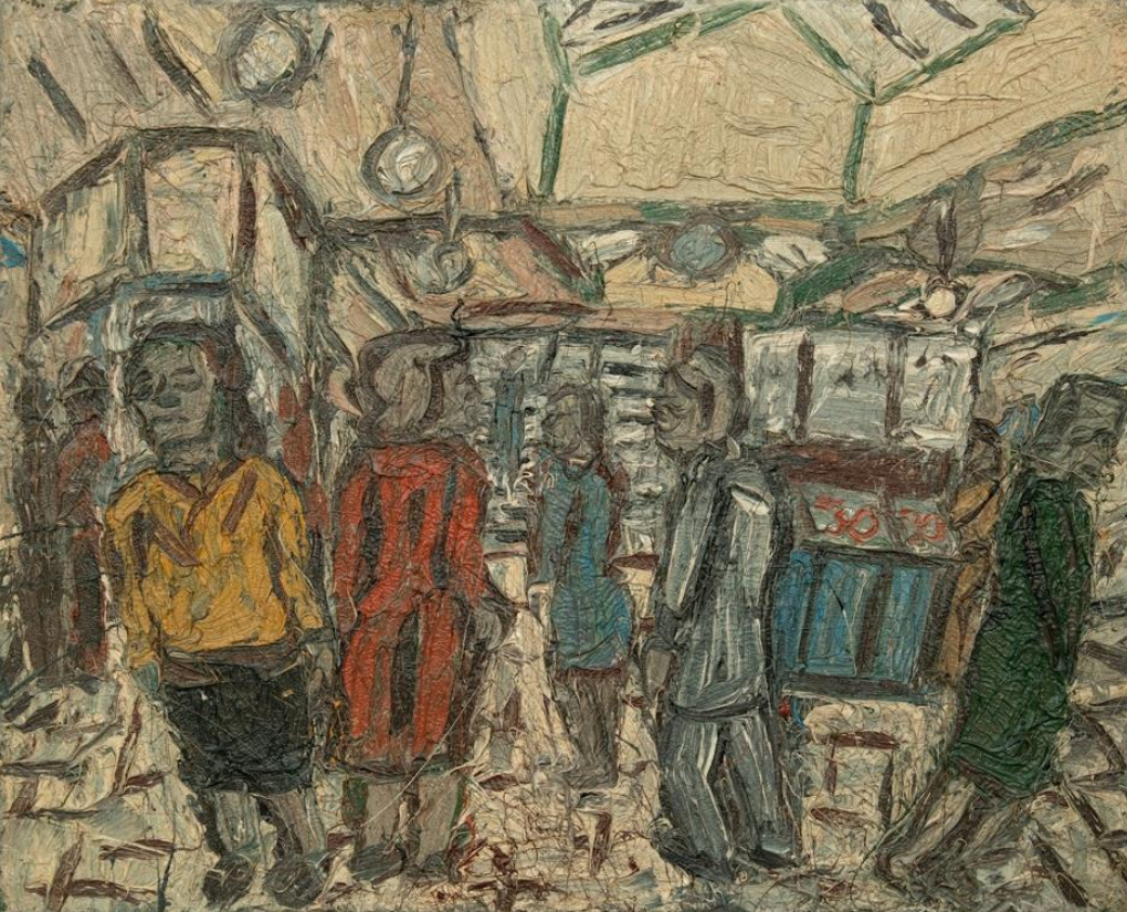
Şekil 6. Leon Kossoff, Bilet Gişesi, Kilburn Metro İstasyonu No 4, 1978, Ahşap Üzerine Yağlıboya, 122x152.5 cm.

Kaynak: https://www.xavierhufkens.com/artists/leon-kossoff?modal=artist-related-artworks#artwork-6