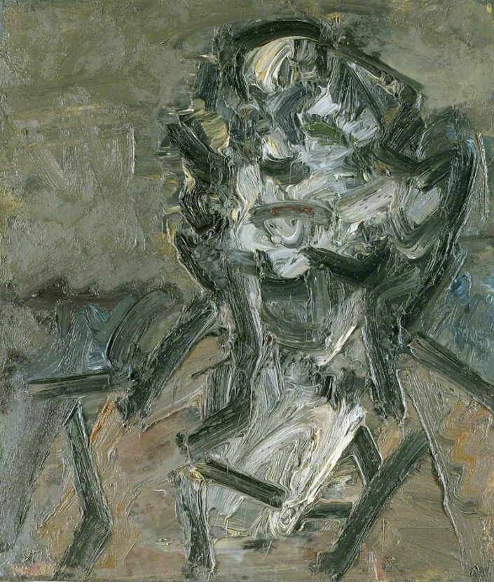
Şekil 2. Frank Auerbach, J.Y.M.'nin Başı III, 1980, Ahşap Üzerine Yağlıboya, 71.1x61 cm.