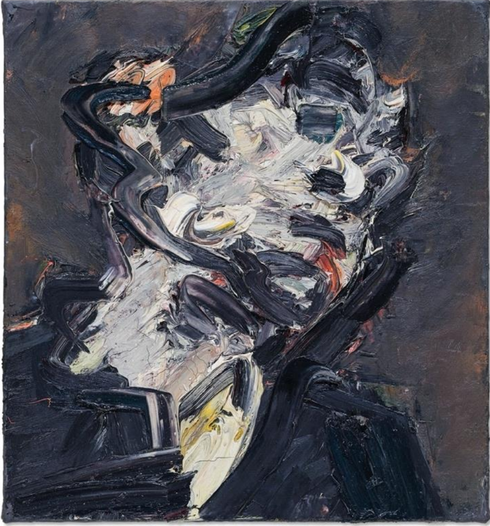
Şekil 1. Frank Auerbach, J.Y.M.'nin Başı, 1984-85, Tuval Üzerine Yağlıboya, 66x61 cm.