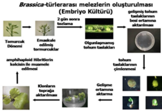
Şekil 1: Brassica napus L. ' de in ovulum kültürü [33]

tem kolza ( B. napus L.) de uygulanabilmekle beraber burada sadece in ovulum kültürü anlatılacaktır.