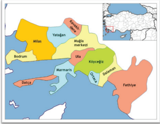
Şekil 2. Muğla İli İlçeleri Lokasyon Haritası [17]

Ortaca ilçesinin kapsadığı topraklar MÖ. 336 ve 323 yılları arasında Makedonya Kralı Büyük İskender tarafından fethedilerek Makedon toprakları haline gelmiştir. Daha sonra bir dönem Mısır Kraliçesi Kleopatra'nın egemenliğinde kalan bölge MÖ 192 yılından itibaren Roma İmparatorluğu egemenliğine girmiştir. 1071 sonrası Anadolu'da Türk egemenliği dönemine kadar da önce Roma, sonra Doğu Roma egemenliğinde kalmıştır [15].